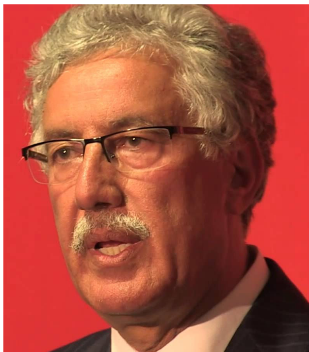
חמה אל-המאמי

אנו מודאגים מכך. שתי המפלגות הגדולות, נידא תוניס ואל-נהדה, משתפות פעולה על-מנת למנוע את הדמוקרטיזציה של השלטון המקומי. הן אפילו מנסות לרדחות את חקיקת חוק הרשויות המקומיות, האמור לקבוע את סמכויות ראשי הערים והמועצות הנבחרות. הן הציעו, שבמידה שלא יסתיים תהליך החקיקה, יוחזר לתוקפו החוק הישן, שנחקק אי שם ב-1975. ברור לכל שהן לא מעוניינות בבחירות. שתי המפלגות מובילות את תוניסיה לעברי פי פחת ואינן נותנות מענה למשבר הפוליטי, הדתי, החברתי והכלכלי הפוקד את המדינה.