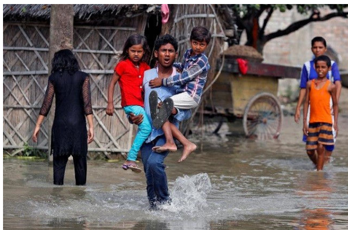
השיטפונות בהודו

חלק עצום מעושריו של המערב מתבסס על העוני באפריקה ובאסיה. עושר זה החרוב ועוד מחריב את שאר חלקי כדור הארץ. הקשר בין התחממות כדור הארץ לממדי השיטפונות אינו עומד לדיון. המשבר הסביבתי מתעצם עם הקפיטליזם הגלובלי; השיטפונות האדירים הם עדות לכך. הודעת ארצות הברית, התורמת הראשית לאסון הגדול הצפוי לכדור הארץ, על פרישתה הקרבה מהסכם פריז נמצאת רק ברקע הדיווחים. הנשיא טראמפ יכול להכריז על יום תפילות למען הניצולים ואפילו לתת תרומה "נדיבה" בסך מיליון דולר, מתוך המיליארדים שטקסס תזדקק להם. השוק הפרטי יחגוג שוב את הישגיו, על חשבון הניסיון לרסן את פגעי האקלים, על חשבונן של אסיה ואפריקה.