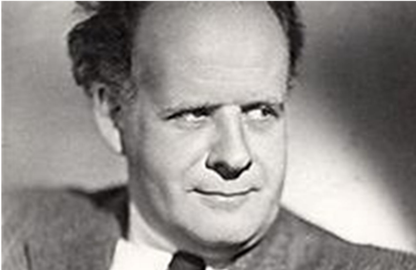
הבימאי סרגיי אייזנשטיין

מלוטה סקורטוב מייצגת את האדם הפשוט במנגנון, הנאמן לשליט – כמו בריה הנאמן לסטלין.