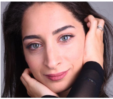
אהבה אחת בשתי שפות עמ' 15