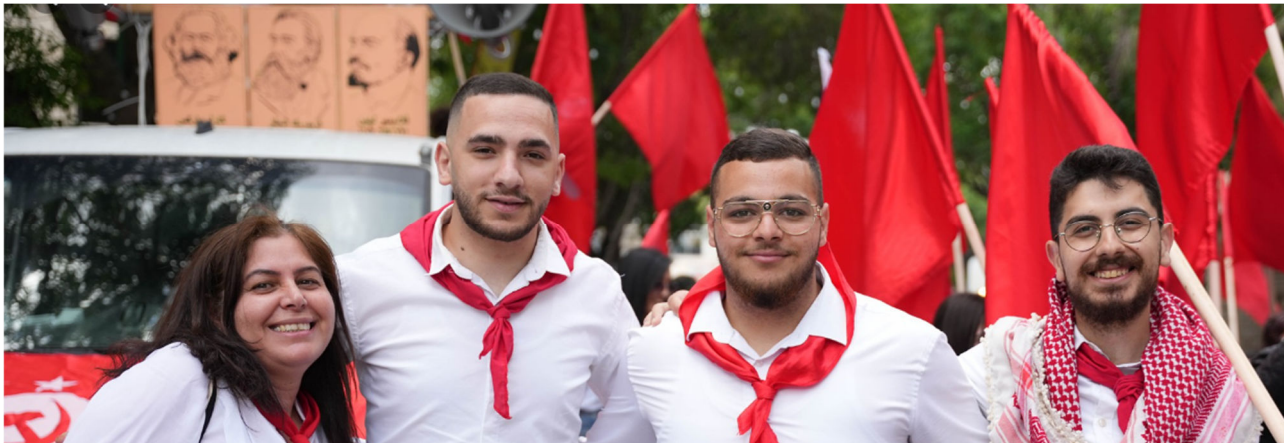
חפגנים בנצרת לציון ה-1 במאי 2023