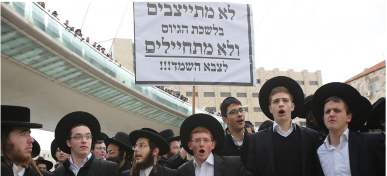
צעירים חרדים מפגינים נגד גיוס לצבא