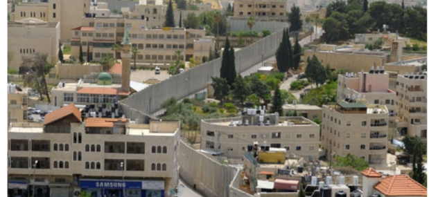
גדר ההפרדה בירושלים

"למלחמה בעזה שפרצה בשבעה באוקטובר היו השלכות מידיות וקשות גם בירושלים המזרחית. האפליה, הדיכוי והפגיעה בזכויות אדם, מהם סובלים הפלסטינים תושבי מזרח ירושלים גם בימי שגרה, החמירו בצורה דרמטית" – כך נכתב לאחרונה בנייר עמדה משותף שפרסמו הארגונים עיר עמים, האגודה לזכויות האזרח, עמק שווה והמוקד להגנת הפרט במלאת שישה חודשים לפרוץ המלחמה.