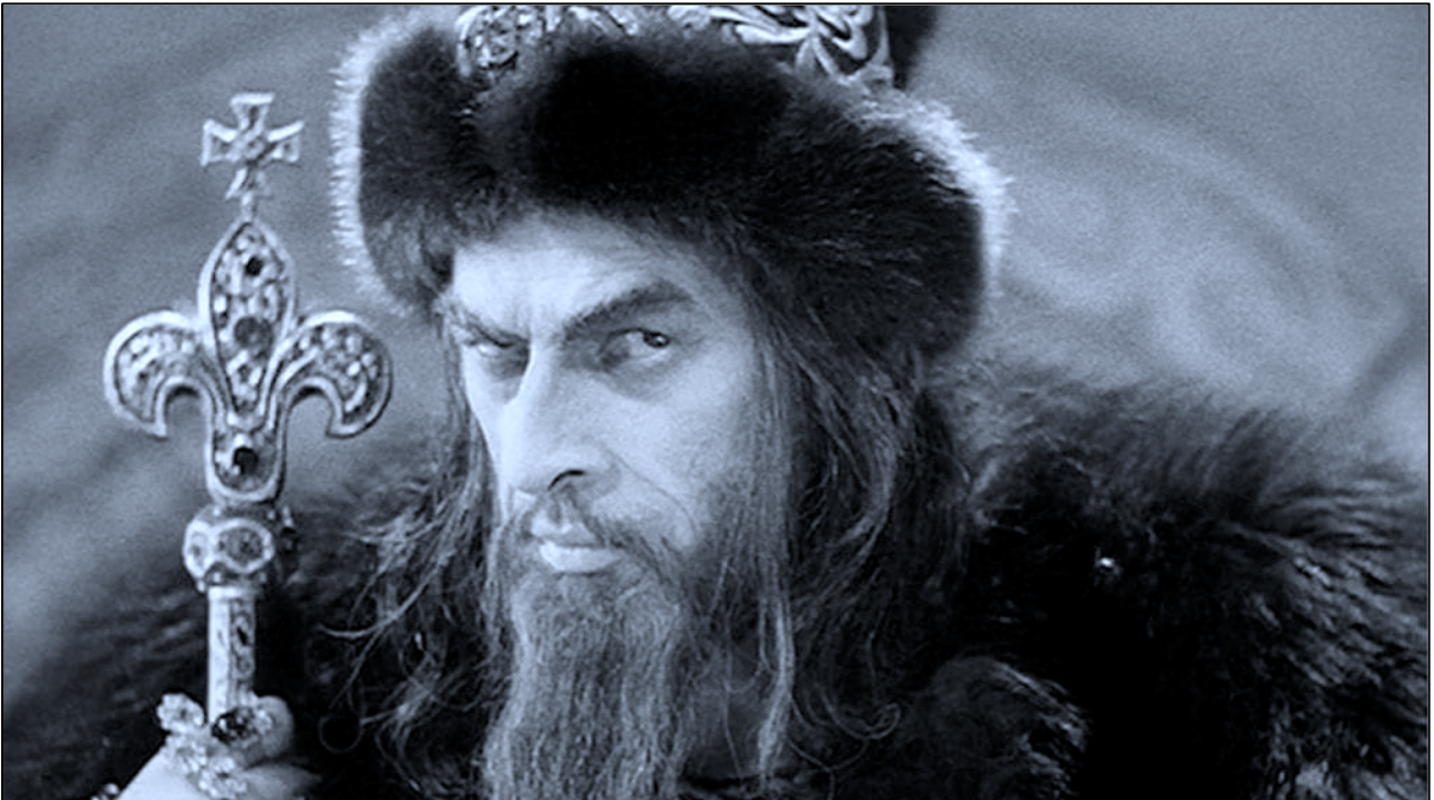
איוון האיזום (צילום מתוך הסרט)