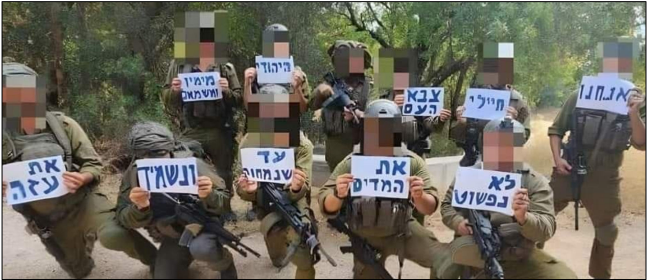
נשבעים להשמיד את עזה