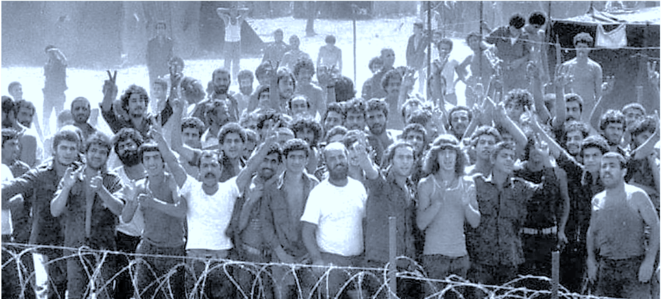
עצירים פלסטינים ולבנונים כפי שצולמו במחנה "אנצאר" בדרום לבנון ב-1982

"זו הדרך" ממליץ על כותרים שפורסמו מאז ראש השנה