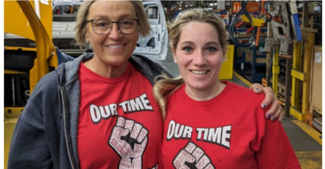
"הגיעה העת" - פועלות בקו הייצור של מפעל פולקסווגן בדרום ארה"ב מרוצות עם הקמת ועד העובדים

עובדי תעשיית הרכב של ארה"ב (UAW) רשמו השבוע הישג היסטורי. לאחר הניצחון בשביתת הרכב הממושכת ב-2023, הפעם הכריז האיגוד על יציגות במפעל פולקסווגן בצ'טנוגה במדינת טנסי. בכך היה המפעל בצ'טנוגה מפעל הרכב הראשון בדרום האמריקאי שהתאגד באופן רשמי מאז שנות ה-40 של המאה שעברה.