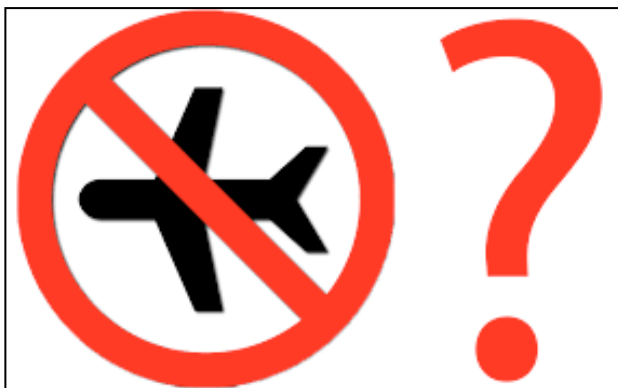
מהן השלכות אזור אסור בטיסה בסוריה?

ישראל הרשמית טוענת שאינה מעורבת בעימותים הצבאיים בסוריה ובעיראק. ישראל גם לא הייתה שותפה בקואליציה אמריקאית למלחמתית. גם אם יתממשו הציפיות של פפר ודומיו וארה"ב תקים מתי שהוא קואליציה למלחמה בסוריה בתירוץ של הצלת חאלב או