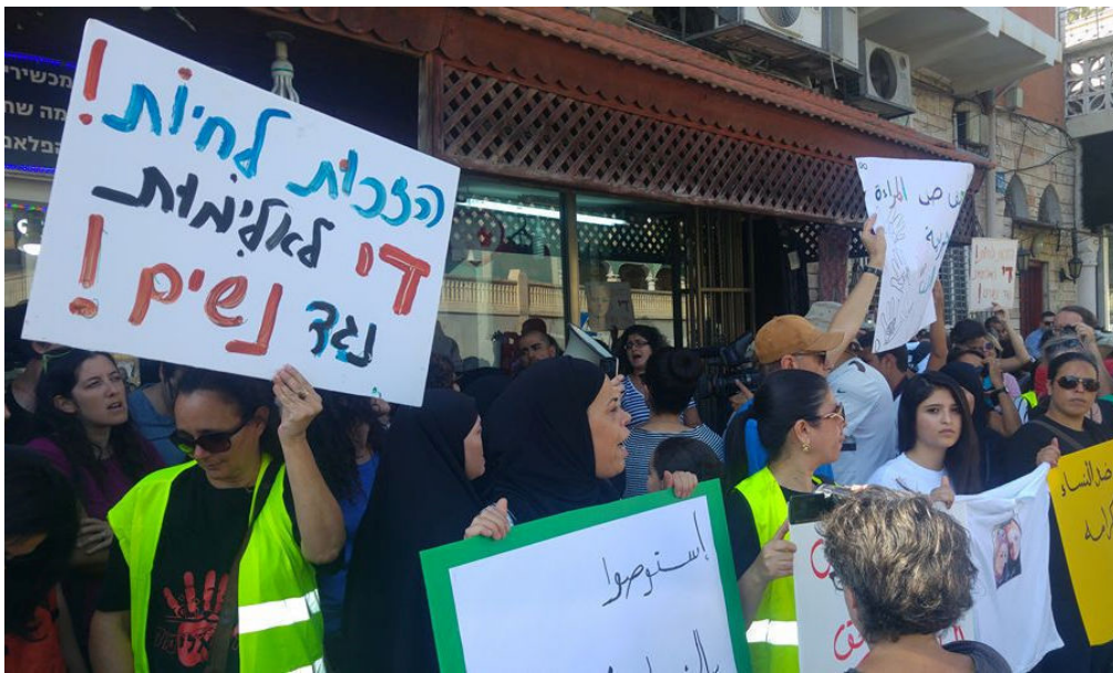
המפגינות ברחוב יפת

הפגנת זעם ביפו נגד רצח נשים, שמוסיף לגבות חיים ללא מענה