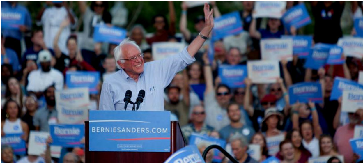
סאנדרס בעצרת בחירות

"הייתה התקרבות משמעותית בין שני הקמפינים. בעקבות זה ייצרנו את המצע הפרוגרסיבי ביותר בהיסטוריה של המפלגה הדמוקרטית" - אמר סאנדרס בוועידת המפלגה הדמוקרטית ביולי. "התפקיד שלנו הוא לוודא שהמצע הזה מיושם על ידי סנאט ובית נבחרים בעלי רוב דמוקרטי, ועל ידי קלינטון כנשיאה. אני מתכוון לעשות כל שביכולתי כדי שזה יקרה".