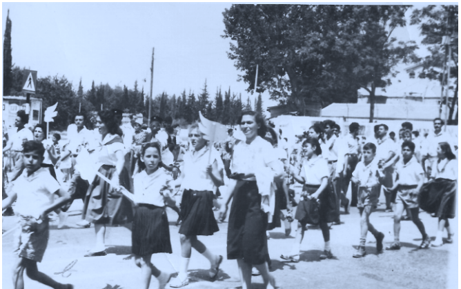
1 במאי ברמלה בשנות ה-50