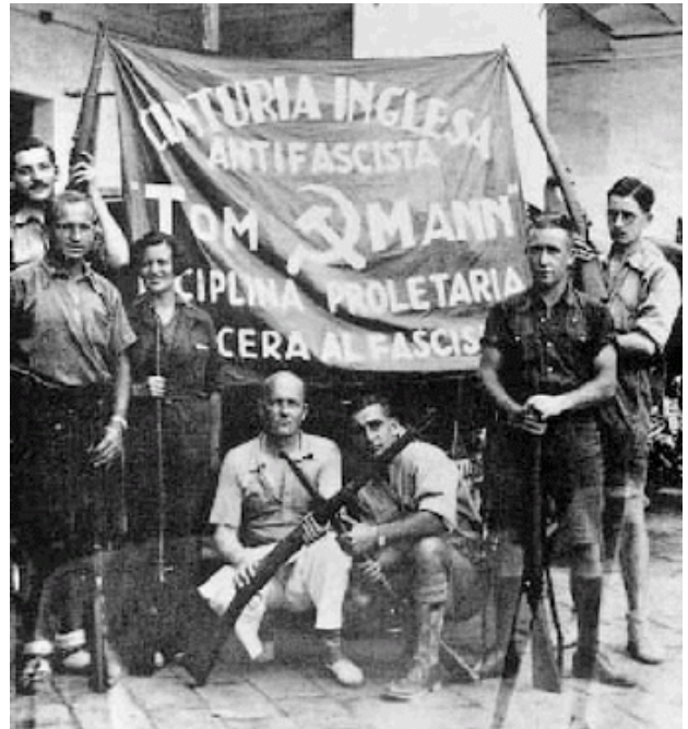
מתנדבי הבריגדות הבינלאומיות מבריתניה