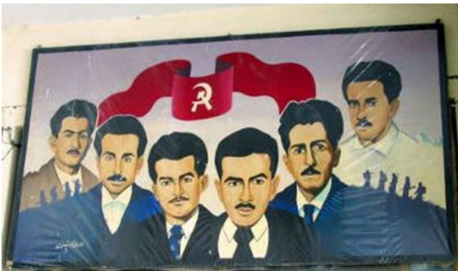
קומוניסטים עיראקים

את דו"ח הוועדה להעצמת יהדות המזרח במערכת החינוך, שבראשה עמד המשורר ארו ביטון, צריך לקרוא. קראתי, התעצבנתי על הניסיון להבליע גם את ההיסטוריה והתרבות של הקהילות היהודיות המזרחיות (הלא אשכנזיות) בתפיסת העולם הציונית בדבר "יחד שבטי ישראל" ולנצלן לדתיות המתפשטת במערכת החינוך הכללית, אך שמתי לב גם לחדירתו, במקומות מסוימים, של שיח היסטורי חלופי.