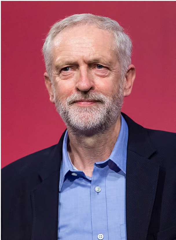
מנהיג הלייבור ג'רמי קורבין: נקט עמדה שקולה נגד היציאה מהאיחוד האירופי, אך בעד רפורמה של אותו איחוד

דו"ח צ'ילקוט נותן אסמכתא רשמית למה שהיה ידוע - וטוב שכך דוח החקירה בדבר מעורבות בריטניה במלחמה בעיראק, או בשמו המוכר "דוח צ'ילקוט", על שם יושב ראש ועדת החקירה ג'ון צ'ילקוט, פורסם ב-6 ביולי השנה לאחר שש שנות חקירה. יותר מ-6,000 עמודי הדוח פורסמו במועד נוח למעמד השליט באנגליה, בו רוב תשומת הלב ניתנת לברקסיט ולהשלכותיו, כולל לחילופי הממשלה בבריטניה. אך עיקרי החקירה, גם אם אינם מפתיעים, נותנים אסמכתא רשמית לטענות מרכזיות של השמאל הבריטי והעולמי נגד מלחמת עיראק. צ'ילקוט מציג את רה"מ דאז, טוני בלייר, כאחראי ישיר להונאה בקנה מידה גדול של דעת הקהל הבריטית והעולמית. לפי הדו"ח, המלחמה בעיראק לא הייתה מוצא אחרון. צעדים דיפלומטיים ליצירת יציבות באזור ולמניעת הפצת נשק להשמדה המונית (שבדיעבד כמובן לא נמצא) - לא מוצו. כלומר - המלחמה בעיראק הייתה מלחמת ברירה. כמו כן נאמר כי סדאם חוסיין ומשטרו לא היו איום לאינטרסים בריטיים ישירים. תגובתו של בלייר הייתה, כי הוא "מאמין שעשינו את ההחלטה הנכונה, וכי העולם טוב יותר ובטוח יותר". מעניין, כי בלייר בוחר במילים אלה שבוע בלבד אחרי שפיגוע ענק הרג כמעט 300 איש בעיראק הפצועה והמדממת מאז הפלישה הבריטית-אמריקאית לפני 13 שנה.