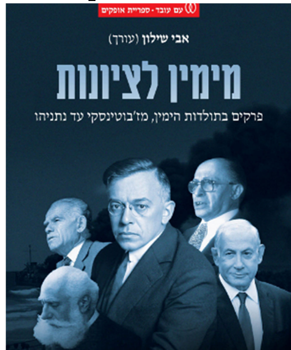
כריכת הספר "מימין לציונות"