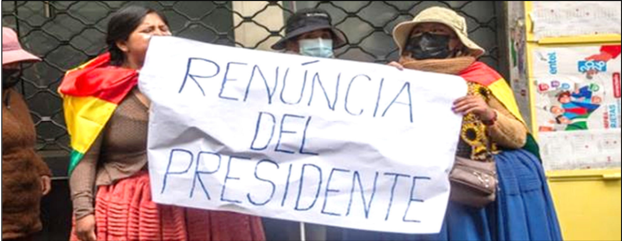
תפגישה במרכז לה פאס: "הנשיא הביתה!", 25 במאי 2026