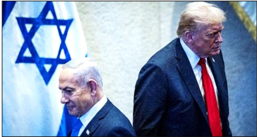
טראמפ ונתניהו בכנסת במהלך ביקורו בארץ באוקטובר 2025

אך בינתיים מנצלת ממשלת ישראל את הזמן כדי לבצע פשעי מלחמה בשטח הכבוש. לפי עדויות של תושבים בדרום לבנון, תמונות לוויין וצילומים של עיתונאים הפועלים בשטח, ישראל מנהלת מדיניות נרחבת של הרס כפרים בשטחי שליטתה. סוכנות הידיעות הצרפתית AFP פרסמה הערכה לפיה יותר מ-50 אלף יחידות דיור נהרסו בדרום לבנון מאז תחילת המלחמה ב-2 במרס. בארגוני זכויות אדם מכנים מדיניות זו, שנועדה למנוע מתושבי האזור לשוב לבתיהם אחרי המלחמה, "דומיסייד" – הלחם שבנוי מהמילים "דומוס" (בית בלטינית)