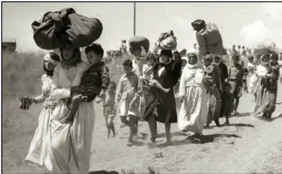
פלסטינים נעקרים מטנטורה, 1948

אזנבי היכן שממוקם כיום פארק העצמאות ובבית הקברות אל-אסעאף ביפו שבו נבנה גגון למחוסרי דיור ב-2020. לדבריה, מאבק תושבי יפו נגד הבנייה על בית הקברות אל-אסעאף יצרה לראשונה שיח ציבורי רחב יותר על "הזכות לעיר" של האוכלוסייה הפלסטינית. "התושבים נאבקו לא רק נגד הממשלה, אלא גם מול העירייה ומול חולדאי, מתוך דרישה להיות חלק מהמרחב ומהזיכרון העירוני", אמרה.