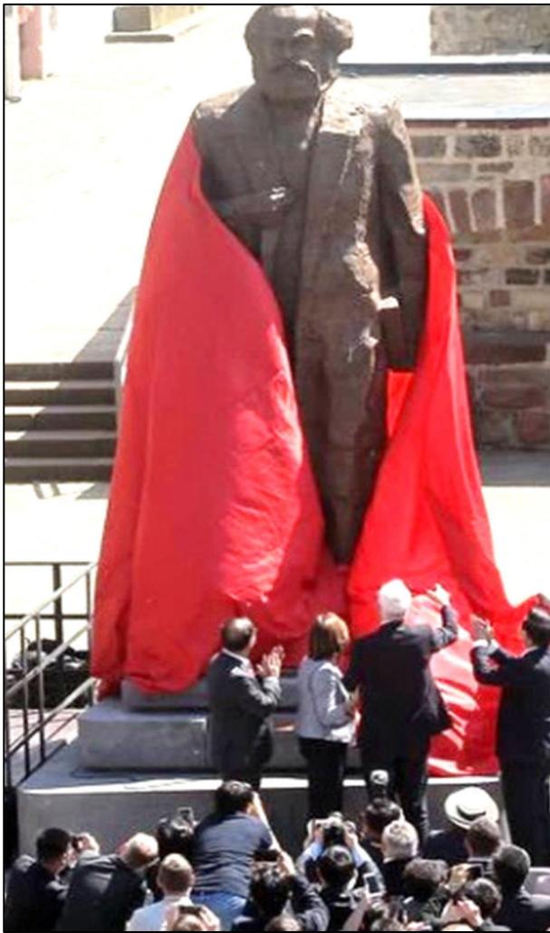
פסל של קרל מרקס שנחנך ב-2018 בטרייר, תרומה של ממשלת סין לציין 200 שנה להולדתו בעיר

ששרדו את מלחמת האזרחים הספרדית ונאסרו תחת המשטר הפשיסטי.