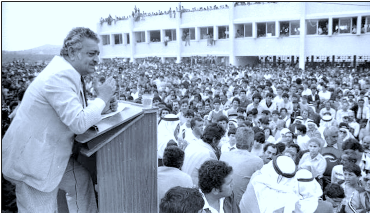
אמיל חביבי נואם מול האלפים שציינו את יום האדמה ה-9 בסחנין, 1985