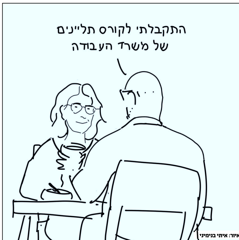
איור: איתי בנימיני

מסרו: "בזמן שהציבור הישראלי יושב במקלטים, ממשלת הטבח מאשרת תקציב חזירי. במקום לדאוג להגנה על הצפון, לפיזיו העסקים, העובדים, ותושבי המדינה המופגזים, הם מזרימים מיליארדים למשתמטים ולהתנחלויות."