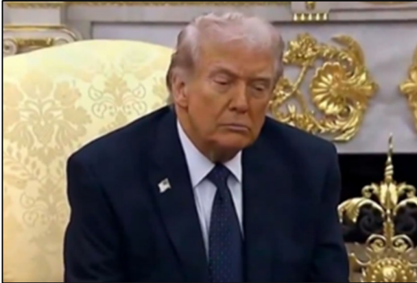
טראמפ לא משועמם מהמלחמה, צילום מחסיבת עיתונאים שערך השבוע

מלחמת הסחר, היא מתכון למשבר קפיטליסטי עולמי. כך המלחמה האימפריאליסטית של טראמפ עלולה להפוך משבר קפיטליסטי. אבל צריך לשמור על סבלנות, עוד לא הגענו לשם, לטראמפ לא משעמם.