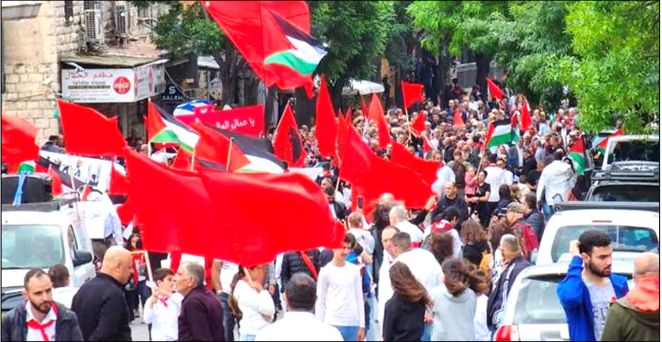
הפגנת ה-1 במאי בנצרת, 2023