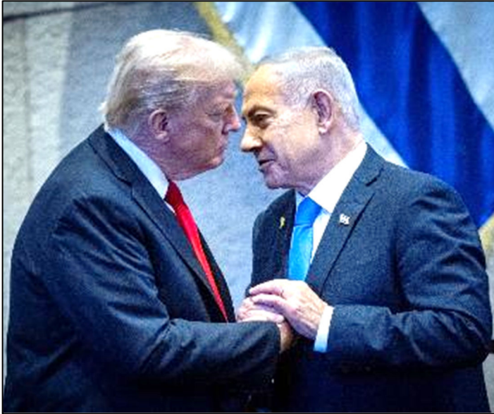
נתניהו וטראמפ בכנסת, אוקטובר 2025

המייגון בכתי החולים, בהם 56% ממיטות האשפוז ו-41% מחדרי הניתוח אינם ממוגנים. לפי אנגלמן, פגיעת הטיל האיראני בבית החולים סורוקה ביוני האחרון "חייבת לטלטל את הממשלה".