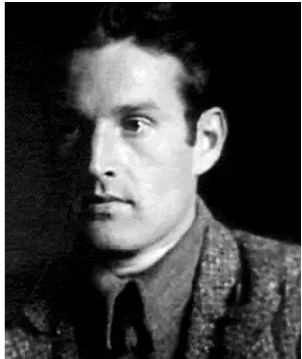
המשורר אלכסנדר פן

רגע אחד דק, כמו בהילות, והלב היפה מביט מן העור הקפוא אל אורות הרחוב. אל איש, אל אישה בסלון ביתם. הכל תם להם. רק המוות נשאר. מדי פעם, היא רוצה כבר למות. עד שעובר לה. רוצה להגיד לו - אבל הלב היפה, היפה עוצר בעדה, משתק אותה. היא נכנסת אל תוך פינת הספה נעלמת, רק לכמה דקות כשחוזרת חושבת על ארוחת הערב חושבת על הים