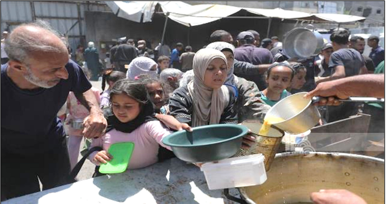
עקורים בתור לאוכל במטבח קהילתי במחנה הפליטים נוסיראת