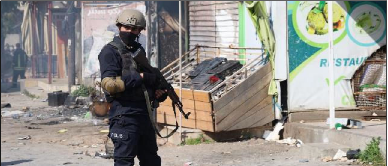
חייל של אחת המיליציות הנאמנות למשטר הסורי, השבוע בפרברי דמשק