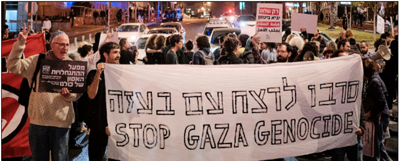
פעילים בחל אביב מפגינים נגד רצח העם בעזה