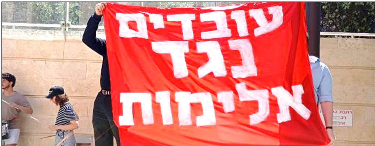
חברי איגוד ועדי התחבורה הציבורית בהפגנה מול משרד התחבורה, ירושלים, 30.4