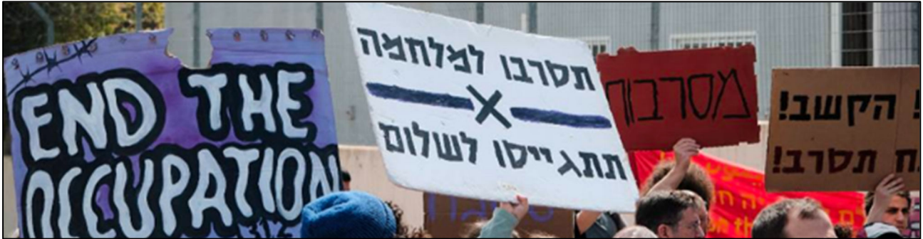
מפגינים מול הבקום בעת התייצבותה של אלה קידר לשירות הצבאי ובתמיכה בסירובה להשתתף במלחמה ובכיבוש, 19 במרס 2025