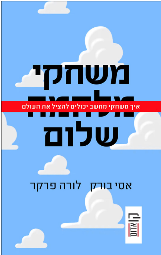
עטיפת הספר "משחקי שלום"

ובמיוחד כלפי צעירים. בפרקים הראשונים מתוארים בני נוער כבורים הזקוקים להכוונה ולחינוך באמצעות משחקים אלה. איני מטיל ספק באמיתות החוויות המתוארות, אך כספר שקהל רחב קורא, היה ראוי שהכותבים ינהגו בזהירות רבה יותר ולא רק יאתגרו את מושאי מחקרם, אלא גם את עמדותיהם שלהם. האם באמת יש "לחנך" את הציבור באמצעים אלו, או שאולי עלינו גם ללמוד מהציבור עליו אנו מבקשים להשפיע? לכן, כקורא, נהניתי מהספר יותר כשהתמקד בסיפורים האישיים כביוגרפיות של פרויקטים, אך פחות כאשר נראה כמו מצגת מכירות המנסה לשכנע אותי באפקטיביות של "משחקים לשינוי" ככלי חדשני לשינוי חברתי. אני ממליץ על הספר בחום – כל עוד אנו קוראים אותו בערבון מוגבל.