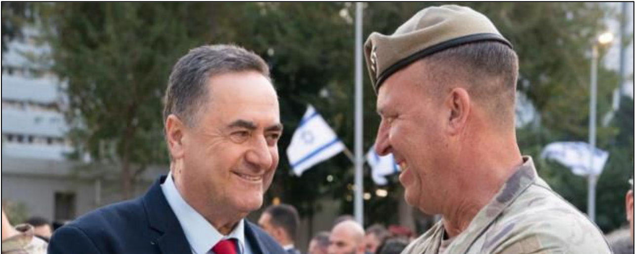
הגנרל האמריקאי מייקל קורילה בעת ביקור בקריה בתל-אביב בשיחה עם פקודו ישראל כ"ץ, 5 במארס 2025