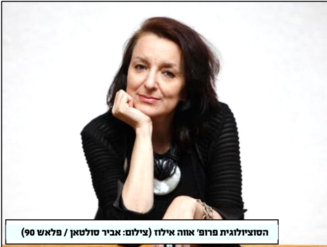
הסוציולוגית פרופ' אווה אילוז

הפחד האמיתי מערעור הביטחון שיצרה ממשלת הימין הפך חרדה קיומית. הסלידה מהאחר או השונה (הערבי או איש השמאל) והטינה המוצדקת כלפי השיטה ההיפר-קפיטליסטית, הומרה בטינה כלפי האליטות וכלפי קבוצות חברתיות שונות. הגאווה הלאומית הבדלנית, הנחשבת כנאמנות לעם, מעצבת את הנפש הישראלית בעת הזאת. המציאות הכאוטית והבעובע הרגשי אפשרו לגורמי ימין קיצוני להעצים ולעודד רגשות פוליטיים אלה, המחזקים את הממשלה ומקשים על הפלתה.