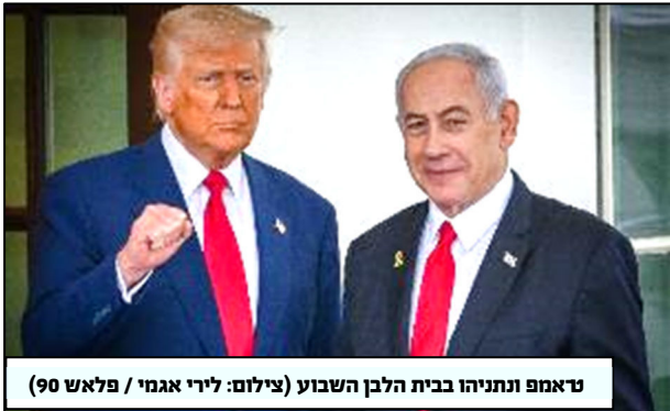
טראמפ ונתניהו בבית הלבן השבוע

החולפת. לפני ימים ספורים, נוכח המחסור בקמח ובגז בישראל, נאלצו להיסגר 25 המאפיות שפעלו במהלך הפסקת האש בתמיכת תוכנית המזון העולמית.