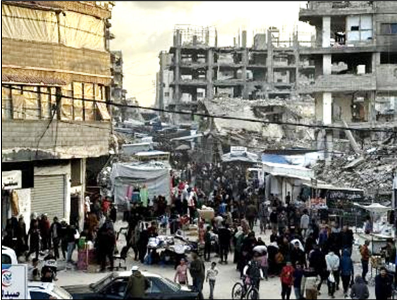
הריסות בשוק חאן יונס

לכן אנו רואים רמות חסרות-תקדים של הפחדה, הטרדה ופעולות ענישה – לא רק נגד יחידים, אלא נגד מדינות החברות באו"ם. קחו לדוגמא את הלחץ המופעל על דרום אפריקה. זו הפחדה בסגנון המאפיה, ואסור להשלים איתה.