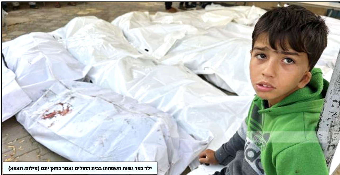
ילד בצד גפות משפחתו בבית החולים נאסר בחאן יונס

הבינלאומית לבין סדר היום שמקדמים גורמים בשטח כולל את, בתפקיד מטעם האו"ם. לעתים קרובות, פעילים בזירה הבינלאומית מאמצים גישה של "הכל או כלום" בטוענם כי צדק לפלסטינים יושג רק עם פירוקה של ישראל. לעומת זאת, גורמים מקומיים והאו"ם עדיין דבקים בפתרון שתי המדינות. כיצד ניתן ליישב בין שתי הגישות?