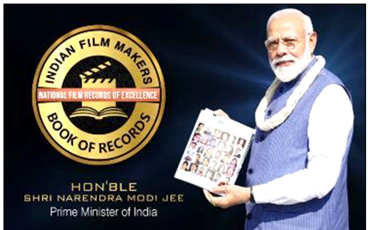
ראש ממשלת הודו, נרנדה מודי, מכבד בפרסום של איגוד יוצרי הקולנוע ההודים

בהודו, הקולנוע הוא חלק בלתי נפרד מהמרחב הציבורי, התרבותי והפוליטי. תעשיית הסרטים ההודית – מהגדולות בעולם – אינה רק מקור לבידור, אלא גם כלי משמעותי בעיצוב תודעה והשפעה חברתית. שחקני קולנוע הפכו דמויות פוליטיות מרכזיות, וכמה מהם אף נבחרו לתפקידי הנהגה. הסרטים זוכים בהפצה מסיבית ובעיסוק ציבורי נרחב. דבריהם של השחקנים הפופולריים בהודו לעיתים נחשבים יותר ממילותיהם של פוליטיקאים. בעשור האחרון, ובעיקר מאז עליית BJP לשלטון, הקולנוע ההודי המרכזי הוא זירה פוליטית בה מתנגשים ערכי הלאומנות והדת של השלטון המרכזי עם ערכים כמו שוויון, לאומיות חילונית ושוויון מגדרי.