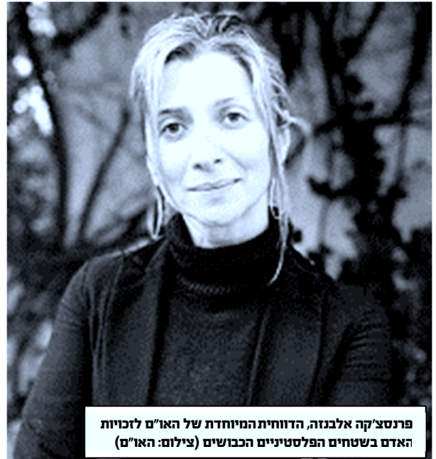
פרנצ'קה אלבנזה, הדווחית המיוחדת של האו"ם לזכויות האדם בשטחים הפלסטיניים הכבושים

לשום מדינה אין סמכות מוסרית לשפוט מדינה אחרת. אך ברמה הבינלאומית כל מדינה אחראית ליחסה לאזרחיה. מה שאנו עדים לו בישראל אינו רק פגיעה של המדינה באזרחיה, אלא גם דיכוי של בני אדם משוללי ייצוג פוליטי אמיתי. שלילת זכות ההגדרה העצמית של הפלסטינים מראה כי המערכת המולטי-לטרלית, על כל חוקיה ומנגנוניה, אינה מצליחה להתמודד עם הפרות זכויות האדם והאזרח.