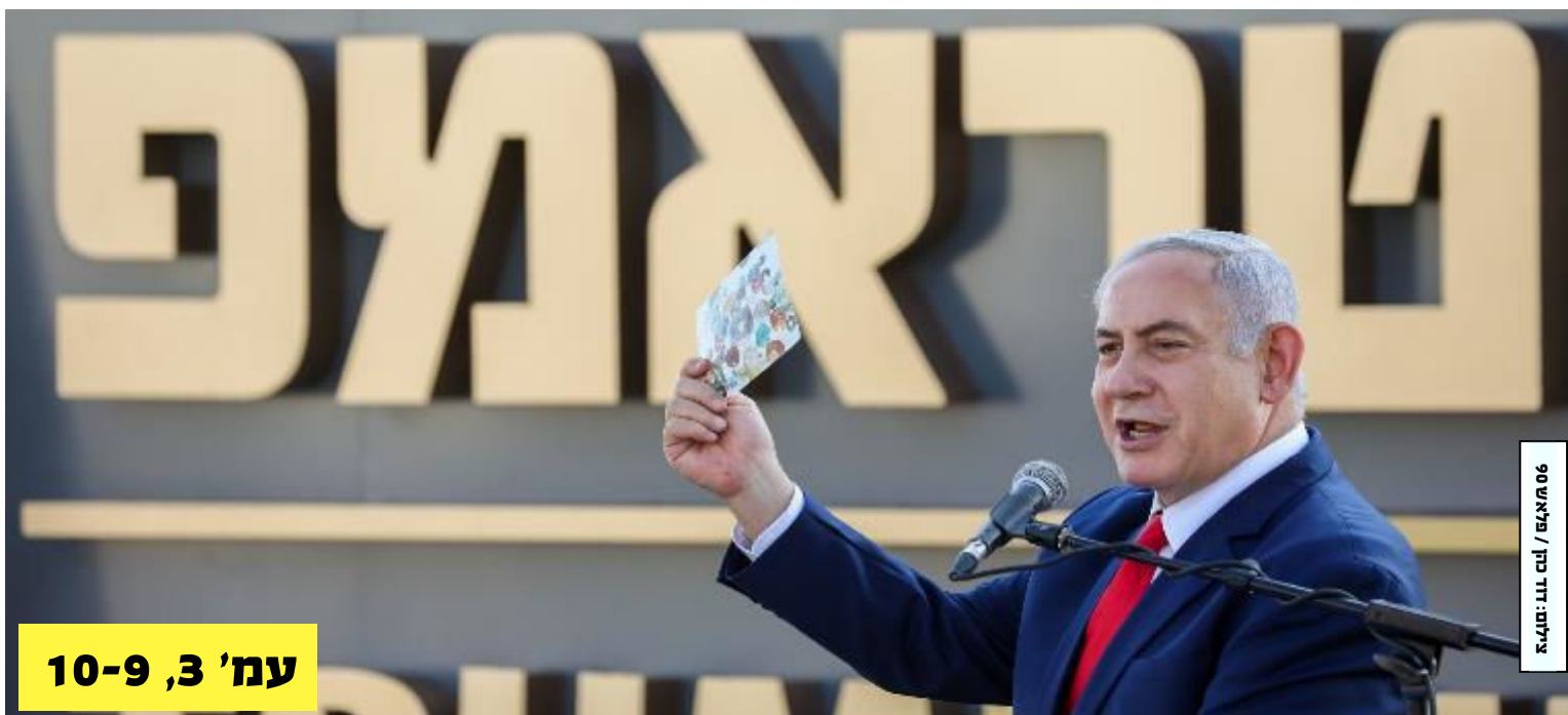
06 מאי / נט טו: מליא