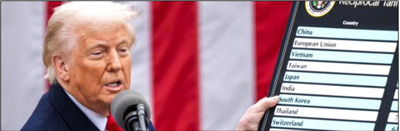
נשיא ארה"ב דונלד טראמפ מציג בבית הלבן את שיעורי המכס שהטיל על יבוא סחורות מארצות שונות, 2 במרס