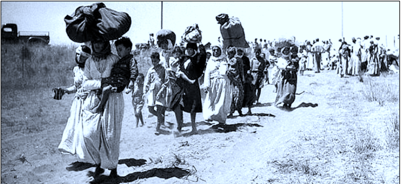
“זוכרת”: גירוש אחרוני התושבים הפלסטינים מכפר סנטורה ב-1948