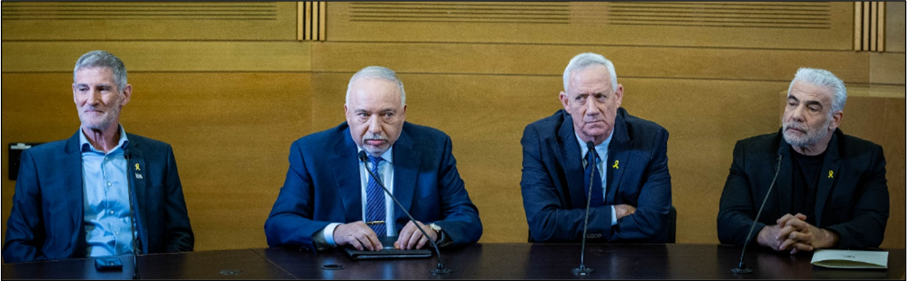
ראשי האופוזיציה הציונית