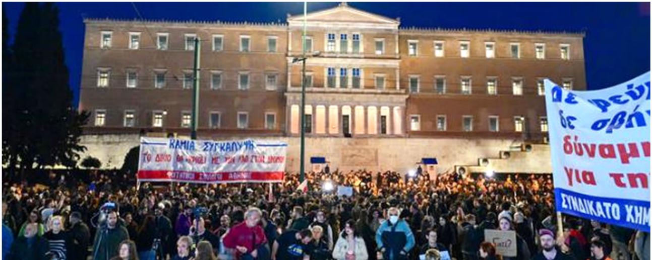
אלפי מפגינים מול בניין הפרלמנט היווני באתונה, השבוע, כחלק מהפגנות ההמונים המתרחשות במדינה