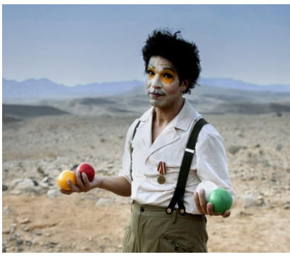
"מופע טוטאל": מרד בפריפריה עמ' 9