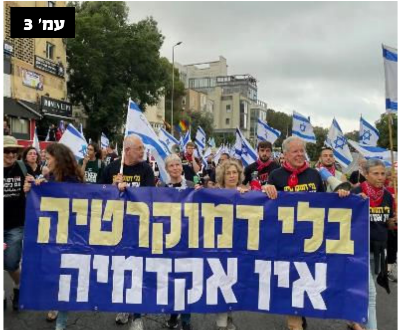
06 מארץ / מוחמד טיטיאוא