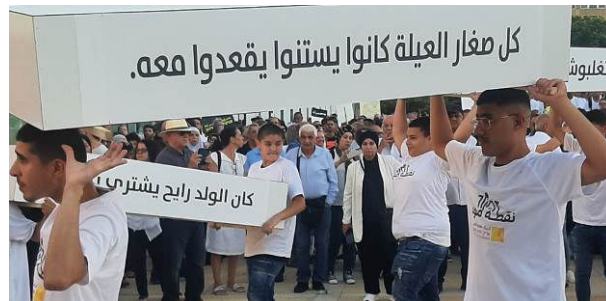
צעירים נושאים ארונות קבורה במצעד המתים, 6 באוגוסט 2023

במצעד לקחו חלק רבים מפעילי המחאה נגד ההפיכה המשטרית, חלקם לבושים בחולצות לבנות כפי שביקשו המארגנים. עם ארגוני המחאה שהצטרפו מהפגנה נמנו התארגנות המרצים מרחבי הארץ "מחאת האקדמיה", "עו"סות דמוקרטיה" ו"אין בריאות נפש בלי דמוקרטיה".