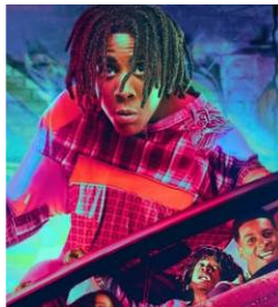
'אני מזל בתולה' עמ' 9