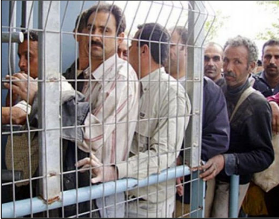
פועלים פלסטינים במחסום בדרכם לישראל

מה שיעמיק את הכיבוש בשטחים הפלסטיניים באמצעות הפקעת הייצוג של העובדים.