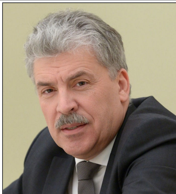
פאבל גורדינין