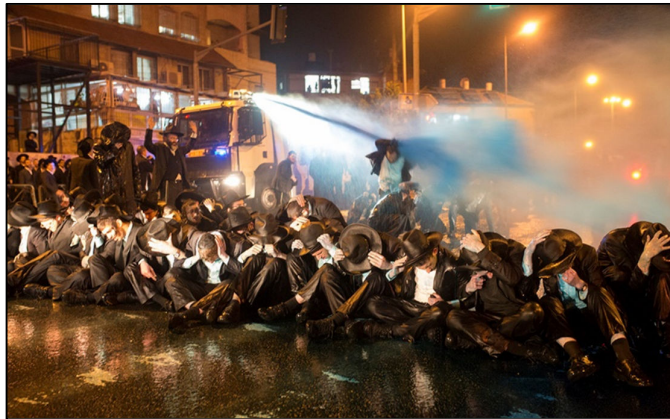
מכת"זית בהפגנה נגד גיוס לצה"ל, 2017

את מי בעצם קוראים לנו לשנוא אותם מסיתים שרואים עצמם אנשי שמאל? הציבור החרדי הוא ציבור עני, שסובל מהמגפה יותר. נכון שרוב הגברים החרדים אינם עובדים, אך גם אילו היו רוצים לעבוד, שוק העבודה בישראל כנראה לא היה מסוגל לספק עבודה לרובם. בחירתם לחיות בעוני איננה לחיות כמובטלים מתוסכלים אלא להתחייב למסגרת חיים שונה, המשמרת את הלכידות הקהילתית ומונעת מהם להידרדר לפשע ולמצוקה. יתר על כן, בניגוד לדימוי הרווח בתקשורת, המציגה את החרדים לעתים קרובות כגוש אחד