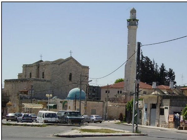
כניסה ומסגד בלוד

המנכ"ל, בשנה הבאה אנו עתידים להחליף את מערכת הטלפונים והמרכזייה. נושא זה יישקל ויילקח בחשבון." בעיר תל אביב-יפו חיים כמה עשרות אלפי ערבים, אולם המוקד של העירייה נותן מענה רק בעברית. אתר העירייה קיים רק בעברית. יש אמנם דף כניסה ראשי בערבית, אך אם