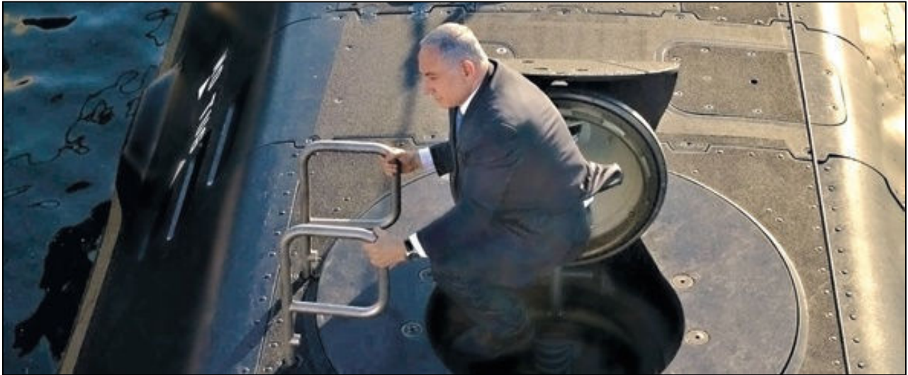
ראש הממשלה בנימין נתניהו מגיח מאחת הצוללות שרכש