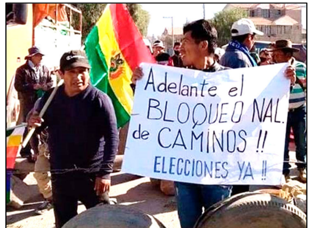
מפגינים בוליביאנים חוסמים כבישים בדרישה לקיום בחירות