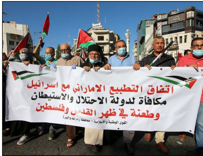
הפגנה פלסטינית בראמאללה, 15.8. על הבאנר: "ההסכם הנורמליזציה האמיראטי עם ישראל הוא פרס למדינת הכיבוש וההתנחלות ודקירה בגב פלסטין"

ומי ירוויח מההסכם החדש? כפי שפורסם ב"דה מרקר" (16.8), עוד לפני ההסכם הסתכם ייצוא הנשק הישראלי לאיחוד האמירויות בעשרות מיליוני שקלים בשנה. סוחרי הנשק הישראליים מקווים לזכות כעת בנתח גדול יותר מרכש הנשק הנכבד של איחוד האמירויות, שתקציב הביטחון שלה עומד על 23 מיליארד דולר בשנה.