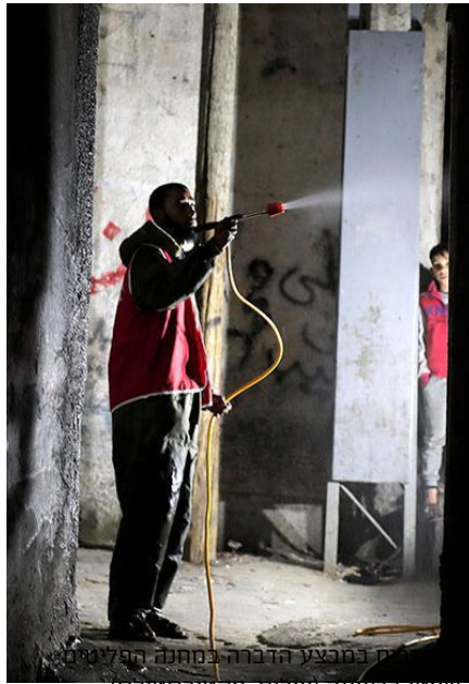
טאטי ברצועה

https://www.ochaopt.org/he/content/covid-19-emergency-situation-report-1