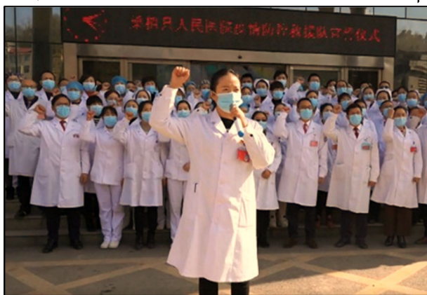
צוות רפואי בעיר ווהאן

מגפה היא תופעה בעלת השלכות פוליטית ברורות. במאה השלישית לספירה הייתה מגפת הדבר אחד הגורמים להתמוטטות האימפריה הרומית. מגפת "המוות השחור" במאה ה-14 הייתה אחת הסיבות לקץ הפאודליזם בבריטניה. המחלות שנשארו הספרדים לאמריקה במאה ה-15 מילאו