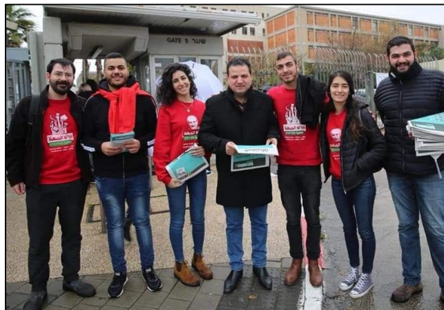
ח"כ איימן עודה בכניסה לאוניברסיטת תל-אביב, יחד עם פעילי חד"ש בקמפוס

"האזרחים הערבים הם יתומים מול הרשויות. חשוב להדגיש שכל צעיר שטעה בחו"ל צריך לקחת אחריות על מעשיו. עם זאת, אין סיבה להפריד אדם ממשפחתו במשך שנים ארוכות בכלא זר", מסר ח"כ עודה. יו"ר הרשימה המשותפת סיפר כי נוסף לאזרחים ערבים, יש גם צעיר ממוצא אתיופי הכלוא בתורכיה, לאחר שנעצר ובכליו עלי גת. הצעיר נידון לתקופת מאסר ממושכת.