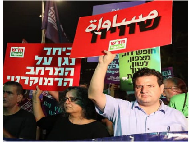
חֲבֵרֵי הַכְּנֶסֶת שֶׁל חֲד"ש בְּהַפְגָּנָה נֹגַד חוֹק הַלְאוּם