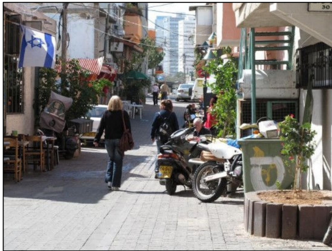
רחוב בכרם התימנים

ההון הנדל"ני בשכונה עדיין זקוק לצעירים ולמוסדות תרבות בשכונה, שכן הם מקור המשיכה המרכזי אליה. עם זאת, מוסדות התיירות ובראשם דירות airbnb מעלים את מחירי הדיור ומקשים על סטודנטים וצעירים להתגורר בשכונה ולבנות בה חיי קהילה.