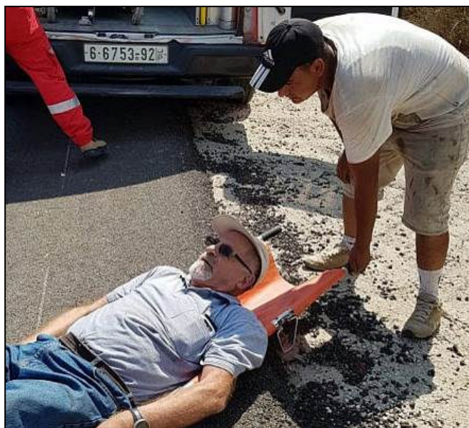
הרב יהודאי לאחר ההתקפה

המפגינים טוענים כי התכנית הכלכלית הממשלתית אינה מספקת מענה הולם לדרישותיהם לצדק חברתי ומדינה מתפקדת המספקת שירותים לאזרח, וקראו להפיל את הממשלה. חיזבאללה התייצבה לימינה של הממשלה, בה היא חברה, וזכתה בביקורת קשה מצד המוחים מכל העדות.