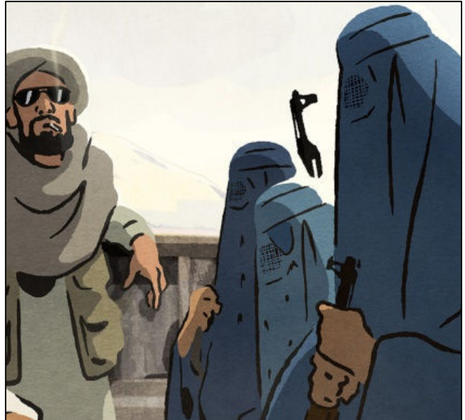
מתוך "הסנוניות של קאבול", סרט אנימציה שיוקרן בפסטיבל

הסרט "קפיטל במאה ה-21" הוא קופרודוקציה צרפתית-ניו זילנדית. זה עיבוד קולנועי עוצמתי לאחד הספרים המשפיעים בדורנו, "הקפיטל במאה ה-21" מאת הכלכלן הצרפתי תומא פיקטי. הסרט הוא מסע פוקח עיניים על עושר וכוח, השומט את הקרקע מתחת להנחה המקובלת שלפיה צבירת הון צועדת יד ביד עם קדמה חברתית. הבמאי ג'סטין פמברטון עוסק בפערים החברתיים בקפיטליזם המאוחר. לשם כך הוא מזמין את הצופים למסע בזמן – החל במהפכה הצרפתית, דרך מלחמות העולם ותמורות גלובליות אחרות, ועד לאימוץ טכנולוגיות חדשות בימינו.