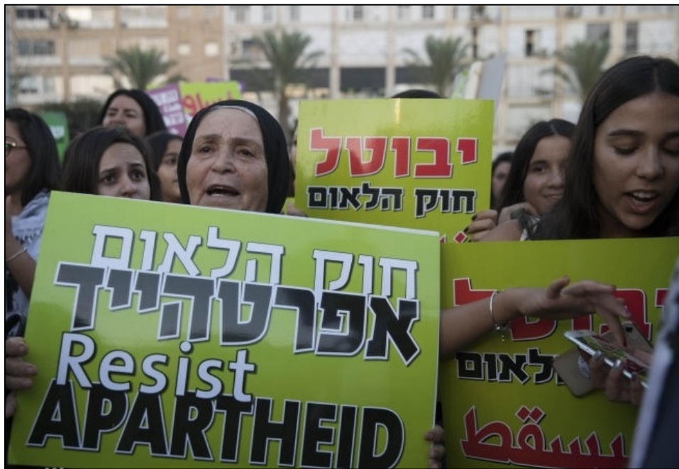
מתוך הפגנה נגד "חוק הלאום" בת"א, 11.8.17