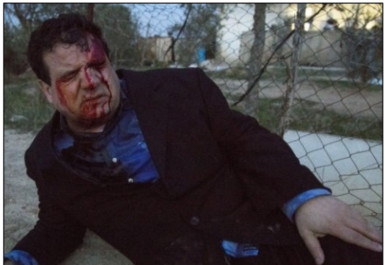
עודה, שניות ספורות לאחר הירי

בניגוד לעמדת מח"ש, מחומרי הראיות עולה כי קיימים לפחות שני חשודים בירי קליע הספוג. אך מח"ש נמנעה מלתשאל אותם על כך. למרות שלפי המחלקה לחקירות שוטרים מוצו כיווני החקירה, עדיין אפשר להצביע על שוטר אחד שירה קליע ספוג לכיוונו של ח"כ עודה מתוך עדותו שלו, ויש