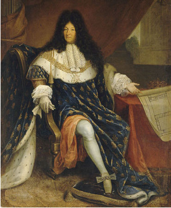
לואי ה-14, "המדינה היא אני" (ציור: ניקולאס רנה ג'וליון)