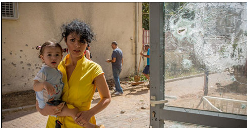
אם ובנה בשדרות, יולי 2014

ממשלת ישראל מסרבת לכל הסדר לגבי עזה. התנאים שהניח חמאס באמצעות מתווכים מצרים על שולחנה, לפני יותר משלושה חודשים, נותרו בעינם: כבר במאי דיווח עמוס הראל ב"הארץ" (6.5) על נכונותו של חמאס לדון בתנאי הודנה ארוכת טווח, שתכלול שיקום של רצועת עזה, הקלות במצור, עסקת חילופי שבויים ומתן אישורים לפרויקטים גדולים בתחום התשתיות. במקום הסדר, נערכו שלושה סבבי לחימה שכמעט הידרדרו למלחמה רחבה. מאות טילים נפלו בדרום הארץ, ואלפי טילים ופגזים של חיל האוויר הישראלי נחתו בשטח הרצועה – גם בשכונות מגורים. כבר יותר