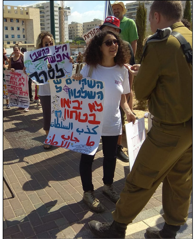
מפגינים בבקו"ם בעת התייצבותו של גרמי, 6.8