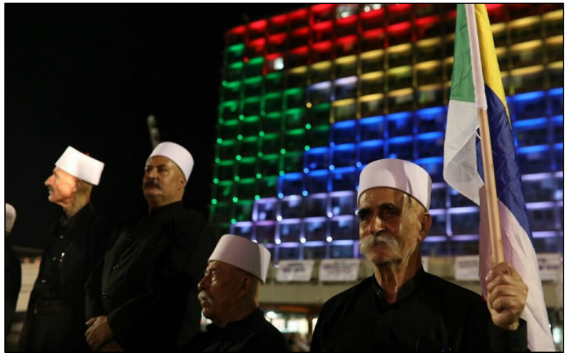
מתוך ההפגנה בכיכר רבין השבוע

רבים בעדה לא קיבלו את המעשה שלי, ולא את מעשם של סרבנים דרוזים נוספים כמו עומר סעד ואחרים. החברה שלנו לא הפסיקה להסית נגדנו ולהוקיע אותנו כבוגדים. אך היו גם רבים, בעיקר בקרב הצעירים, שהעריכו אותנו על החלטתנו לא ללכת בעקבות העדר, ועל כך שסללנו את הדרך לבני דורנו להטיל