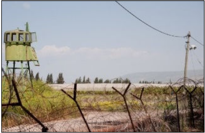
חוזה ישראלית ברמת הגולן

ע', תושב הכפר מסעדה, סיכם בשיחה עם "זו הדרך": "עבור ישראל, הבחירות הללו הן מבחן. זו ההזדמנות של ממשלת ישראל להראות לעולם שאנו, תושבי הגולן הכבוש, כאילו ויתרנו על זיקתנו לסוריה ועל המאבק לסיים את הכיבוש בגולן. זו חובתנו להחרים את הבחירות ולהתנגד לניסיונות החדשים לספח את רמת הגולן".