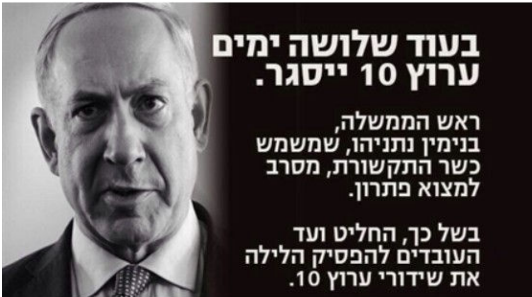
שקופית שהוקרנה בשידורי הערוץ במהלך המאבק המוצלח נגד סגירתו בדצמבר 2014

בהסתדרות הסבירו כי "העילות לסכסוך נוגעות להחלטה החד-צדדית על מיזוג ערוץ 10 עם חברת רשת, מהלך שישפיע על העובדים והעלול להביא לפיטורים רחבי היקף. נציגות העובדים מלינה על כך שהנהלת ערוץ 10 מתנהלת בחוסר תום לב בכל הנוגע לקידום מהלך המיזוג, ללא הידברות ועדכון של ההסתדרות והעובדים. בין היתר מוחים העובדים על כך שהם עודכנו בדבר אישור המיזוג דרך אמצעי התקשורת".