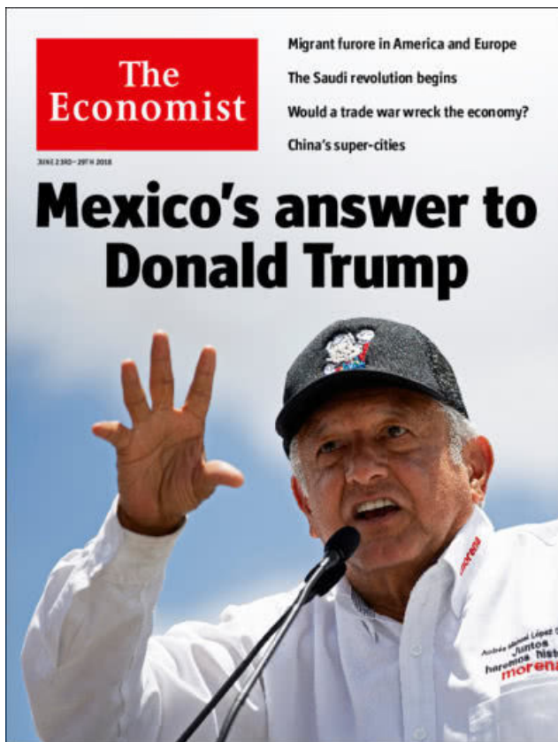
נשיא מקסיקו הנבחר בשער השבועון השמרני הבריטי "אקונומיסט": "התשובה המקסיקנית לטראמפ"