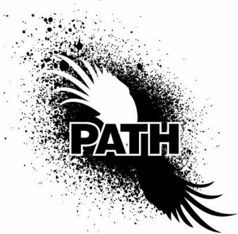
PERFORMING ART THROUGHOUT HATRED

לפני כשבוע הודיע סובול, כי על העצומה כבר חתמו למעלה מאלף אנשים. על אף שתמיכה בסיום הכיבוש ובהקמת מדינה פלסטינית היא אינטרס מובהק של שני העמים, ניכר כי יוזמות המקדמות זאת זוכות להתייחסות מעטה הן בקרב מקבלי ההחלטות בממשלת ישראל והן בקרב התקשורת הממסדית.