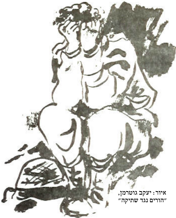
איור: יעקב גוטרמן, "הורים נגד שתיקה"

באחרית דבר לאסופה "ואיך תכלה לקרבות ולהרג – שירה פוליטית על מלחמת לבנון", מסמנים העורכים חנן חבר ו משה רון את מלחמת לבנון כאירוע ספרותי בעל חשיבות. השירה שנכתבה אז ביטאה בכוותם עמדות פוליטיות. חבר ורון מציינים כי עמדות פוליטיות בשירה נבדלות מעמדות מוסריות והומניסטיות. "רק מתן ביטוי, ישיר או עקיף, להשתתפות באחריות למלחמה מסוימת או לגינויה, הוא העושה שיר לשיר פוליטי", כתבו.