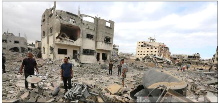
הרס וחורבן באל-בורייג' שבמרכז הרצועה

רבה. אחד מהם הוא - "תוכנית האלופים" שהגה אלוף במיל' גיורא איילנד, הקוראת לשימוש בסיוע ההומניטרי להשבת החטופים ולהכרעת החמאס". לפי תוכנית זו, יכריז הצבא על צפון הרצועה כשטח צבאי סגור ויטיל מצור מלא על האזור עד לכניעת החמאס. האזרחים הפלסטינים בשטח, כ-300,000 איש, יצטרכו לבחור בין להיעקר שוב או לחיות תחת מצור, ללא מים, מזון ותרופות. בתוכנית מצוין כי במידת הצורך יש ליישם אותה גם באזורים אחרים ברצועת עזה.