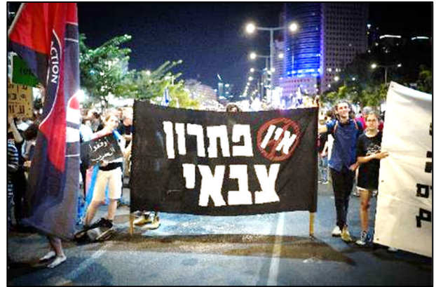
פעילי חד"ש ושוחפות השלום בהפגנה נגד ממשלת הימין ולמען עסקת חטופים

מראש השנה נמצאת ישראל, דה-פקטו, בתחילתה של מלחמה רב-זירתית עם הפלסטינים, חיזבאללה, החות'ים ואיראן. המלחמה הזאת לא הייתה חייבת להתרחב; עדיין ניתן להגיע להסכם עם חמאס. אך ישראל בחרה להרחיב אותה. זו מלחמת ברירה. ממשלת הימין מלא-מלא, ללא התנגדות האופוזיציה הציונית, בחרה לסרב להסכם עם חמאס ובכך