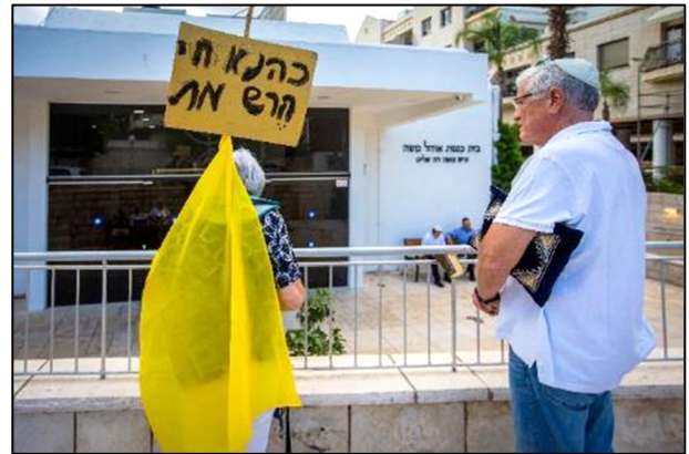
"כהנא חי - הרש מת" מפגינים מול בית הכנסת של ח'כ יולי אדלשטיין

הלחץ הציבורי, שהשפיע על ממשלות ישראל לדורותיהן, נהדף עתה בצורה יעילה בידי רשת של תועמלנים המשרתים את הממשלה. כעת, המשימה שהוטלה על משפחות החטופים והנעדרים לאורך ההיסטוריה הישראלית קשה שבעתים עד בלתי-אפשרית, לפחות בטווח הנראה לעין. ובכל זאת, מציעה הסדרה "שבויים" מעט תקווה לשחרור החטופים בעשותה חיבור היסטורי בין החובה כלפי אלה שנחטפו לפני 50 שנים לבין החובה כלפי אלה שנחטפו לפני שנה.