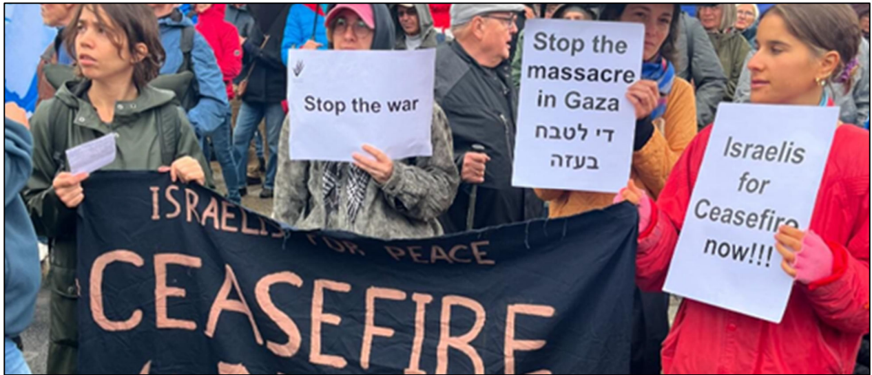
"די לטבח בעזה" - הפגנת רבבות בבירת גרמניה בשבוע שעבר