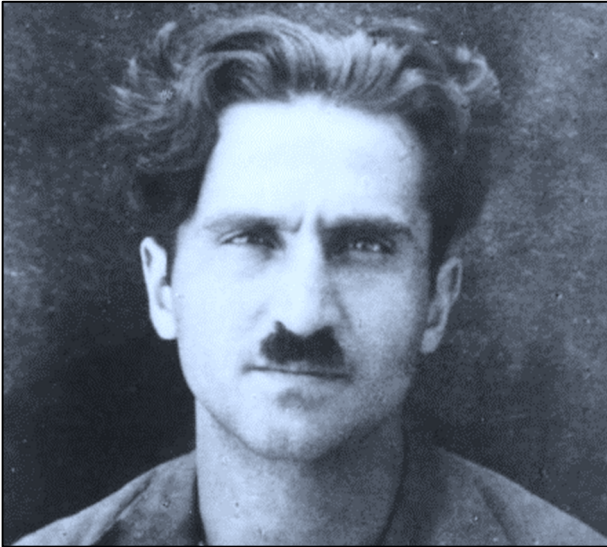
המנהיג הקומוניסטי הפלסטיני מוחמד נג'אתי צדקי