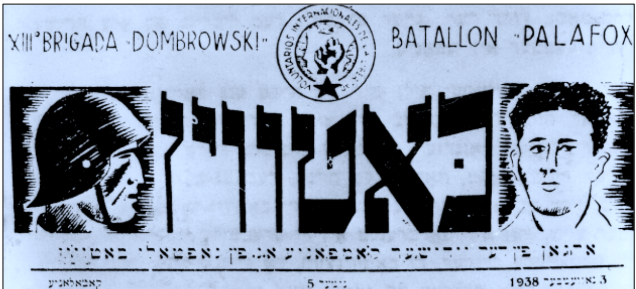
סער הביטאון של "נפתלי בוטווין", פלוגה של יהודים דוברי יידיש שלחמה במסגרת בריגדת דומברובסקי במלחמת האזרחים