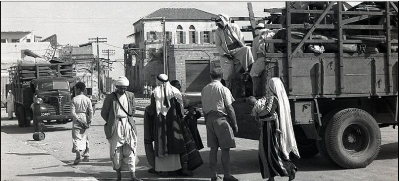
מולדת יקרה: גירוש לרצועת עזה של אחרוני התושבים הפלסטינים ממג'דל (אשקלון) ב-1950