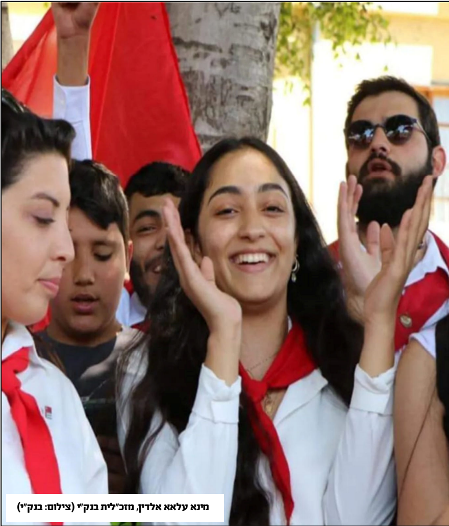
מינא עלאא אלדין, מזכ"לית בנק"י