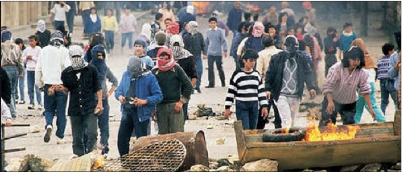
מאבק עממי פלסטיני המוני באינתיפאדה הראשונה, דצמבר 1987