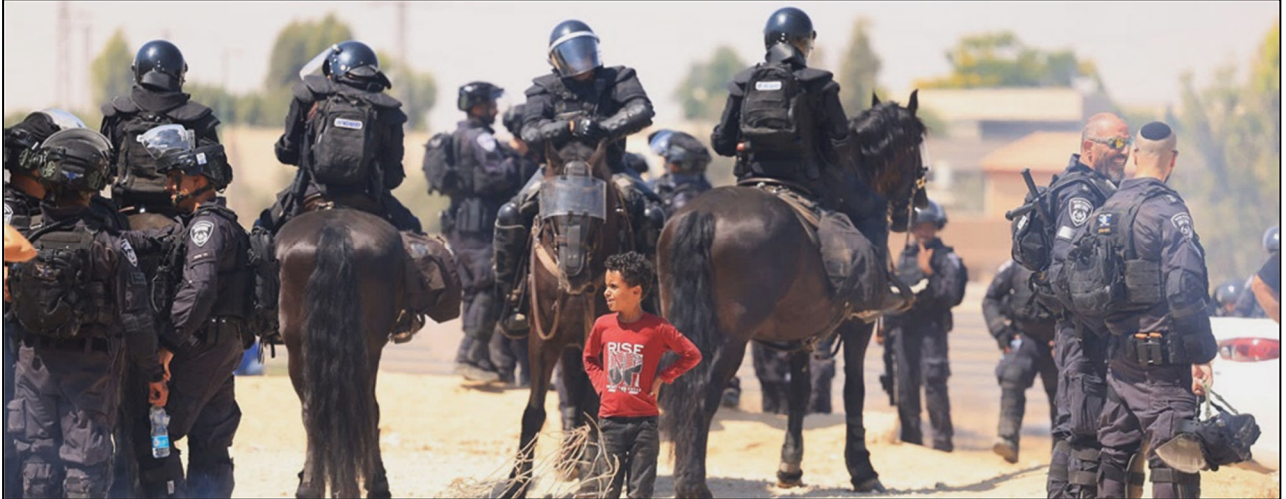
וליד אל-עוברה, "לבדי מול כל העולם", 2024 (צילום מחוץ בתערוכה "זמן נגב")