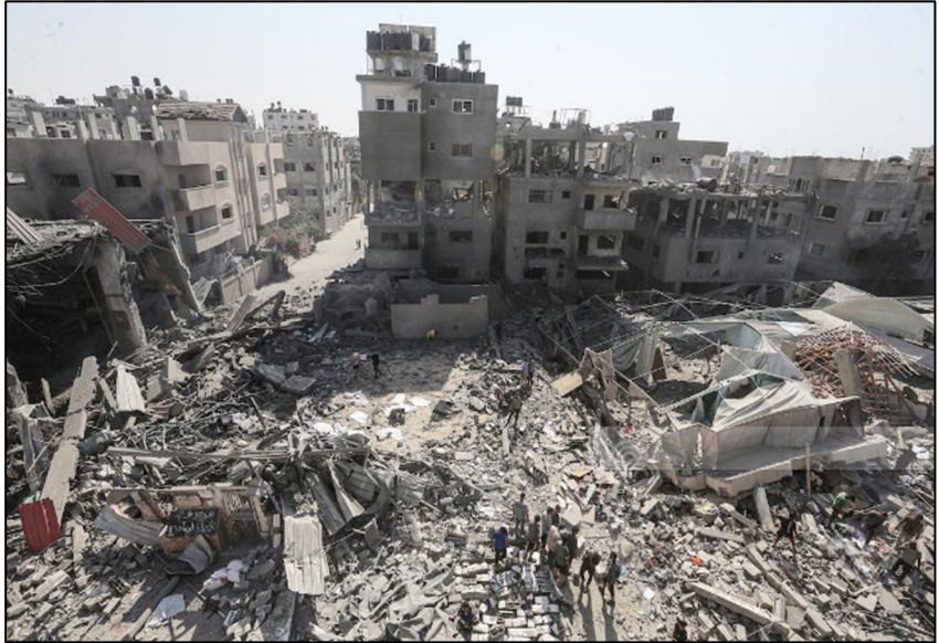
הרס וחורבן באל-בורייג', מרכז רצועת עזה

הדין ההומניטרי הבינלאומי אוסר על הרס רכוש של אזרחי האויב, למעט במקרים של כורח צבאי. הרס מבנים אזרחיים מתוך חשש כי ישמשו בעתיד ללחימה אינו חוקי. גם הרס של רכוש אזרחי משום ששימש בעבר גורמים חמושים אסור, ונחשב לפי הדין הבינלאומי ענישה קולקטיבית. גם כאשר מותר לתקוף מבנה אזרחי, למשל כאשר לוחמי אויב משתמשים בו בעת לחימה, על ההרס להיות מידתי ומוגבל למבנה המסוים.