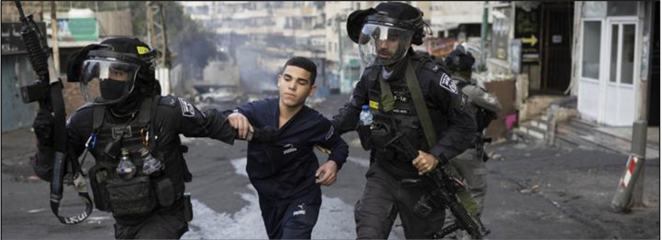
שוטרים עוזרים נער פלסטיני במחנה הפליטים שועפאט, ירושלים המזרחית הכבושה