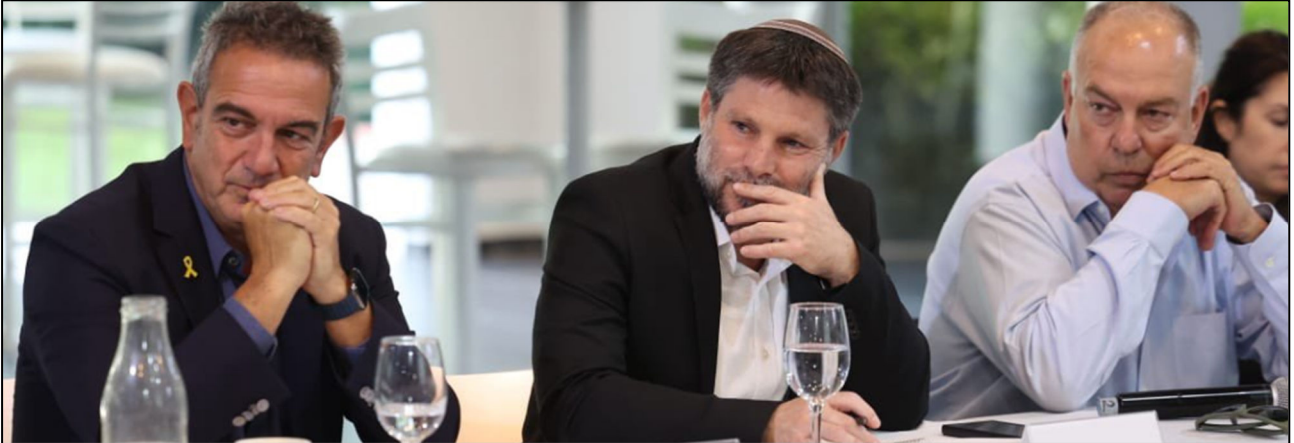
משרתם של שני אדונים: יו"ר נשיאות המגזר העסקי חבי אמיתי, שר האוצר בצלאל סמוטריץ' ונשיא התאחדות התעשיית רון תומר כנס להצגת עיקרי התקציב החדש לנציגי ההון, 29 באוגוסט 2024