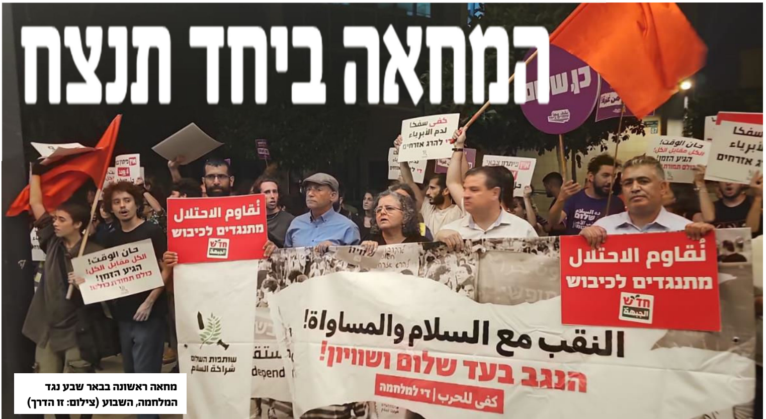
מחאה ראשונה בבאר שבע נגד המלחמה, השבוע