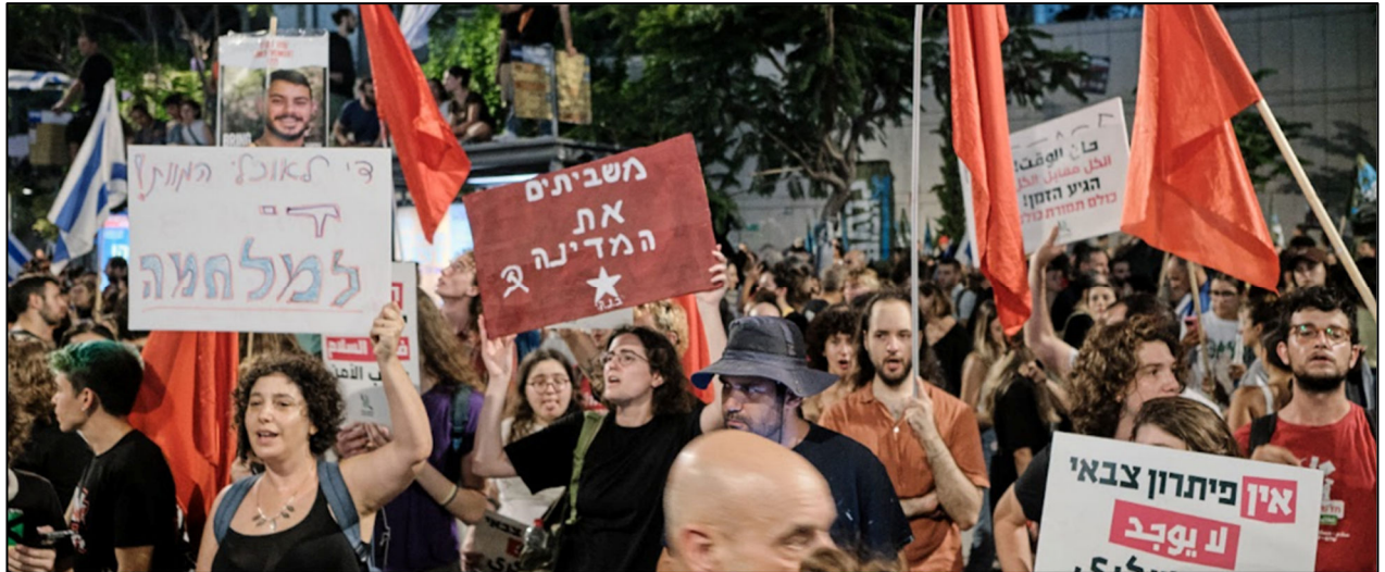
פעילי חד"ש ומק"י בהפגנה הגדולה ב-1.93 בעקבות איתור הגופות של ששת החטופים

איחוד מאבק החטופים והמחאה נגד הממשלה הוא צעד מבורך אך לא מספיק