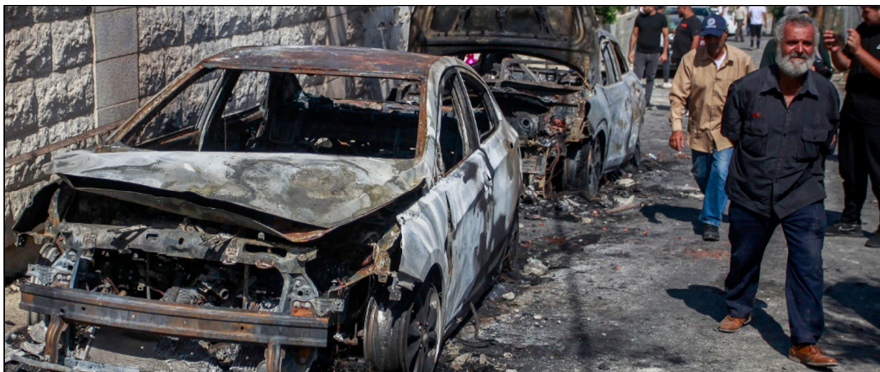
החורבן וההרס בעקבות מתקפת המתנחלים בג'ת