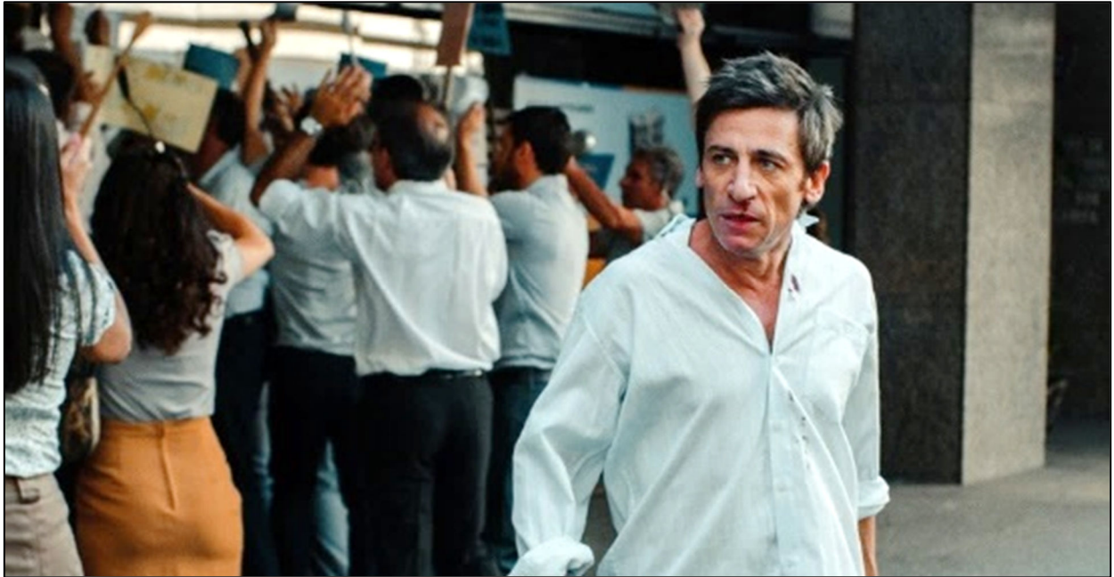
חוליו פרבר, גיבור "אדיוס בואנוס איירס", על רקע מפגינים מול סניף בנק הדורשים לקבל את הסכנותיהם (צילום מתוך הסרט)