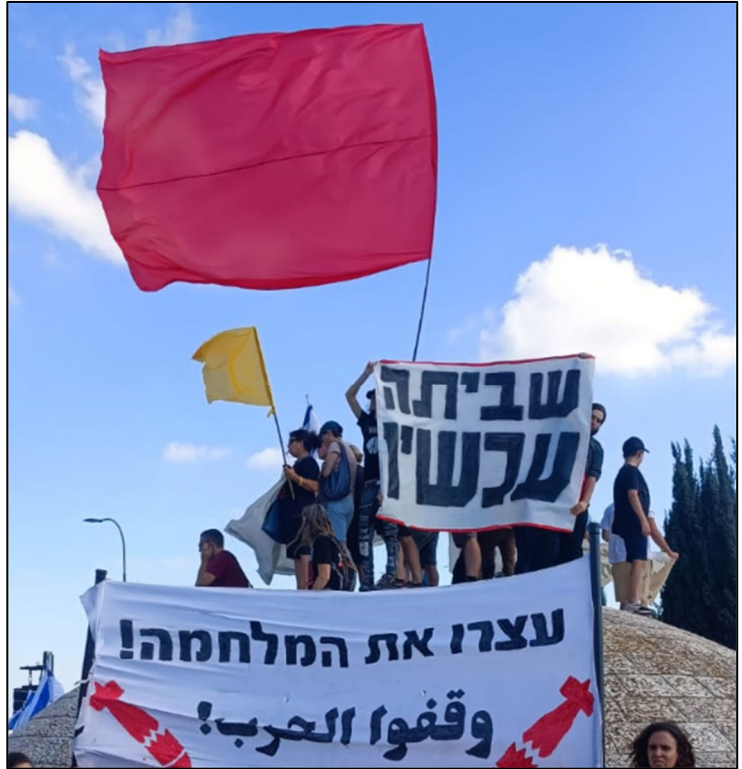
פעיל מק"י וחד"ש קוראים לשביתה כללית למען עסקת חטופים ולסיים המלחמה, השבוע בירושלים

עוד נמסר בהודעה: "אנו תומכים בשביתה שהוכרזה וקוראים להפיכתה לשביתה כללית חסרת מגבלת זמן ותחת סיסמאות ברורות נגד המשך המלחמה. על ציבור העובדים, ערבים ויהודים, לשבות עד שימומש מתווה לסיום המלחמה, תמומש עסקת חילופין, תסולק ממשלת הזוועות ויקודמו סיום הכיבוש והקמתה של מדינה פלסטינית עצמאית בצד מדינת ישראל. לטובת שני העמים בארץ".