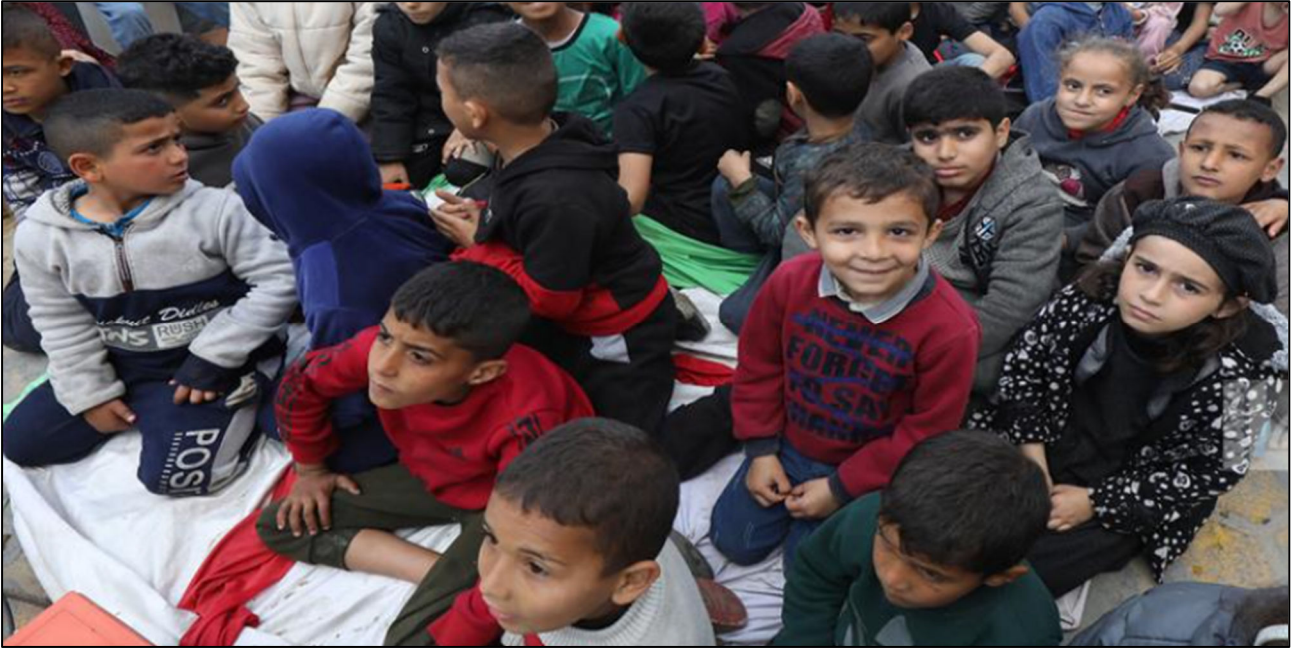
ילדים עקורים בדיר אל-בלח