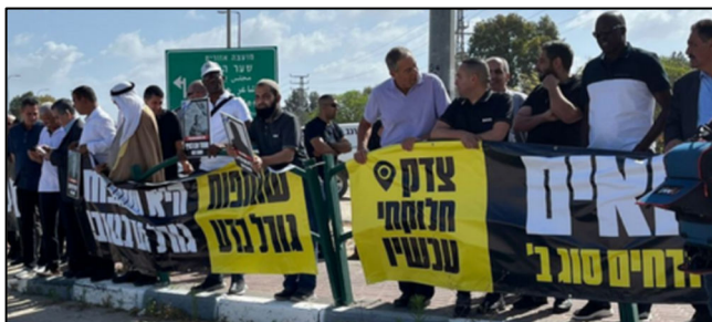
"צדק חלוקתי עכשיו", תושבים מרהט מפגינים במכללת ספיר שלידי שדרות נגד תוכנית השיקום לנגב המערבי של מנהלת תקומה

ההשפעה של התושבים והציבור. צריך לחזק ולשפר את מוסדות התכנון הקיימים – ועדות התכנון המקומיות והמחוזיות שכורעות וקורסות תחת העומס בשל מחסור בכוח אדם ותקציבים בלתי מספקים, ולא לבסס ועדה חדשה שיוצרת בירוקרטיה, סרבול וכפילות נוספים", המליצו המחברים.