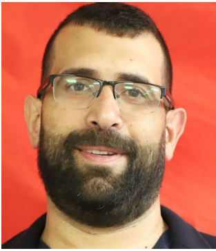
שותפות ערבית-יהודית בזמן אסון עמ' 3