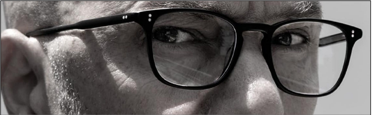
דמותו של כרמי בן נון בגילומו של השחקן דרור קרן (צילום מתוך הסרט)