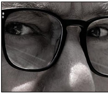
מ"טור פרידה" למציאות מרה עמ' 9