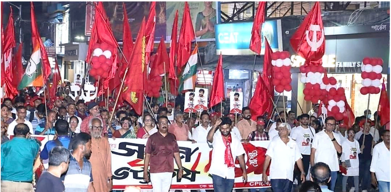
פעילי המפלגה הקומוניסטית המרקסיסטית ההודית בעצרת בחירות במערב בנגל