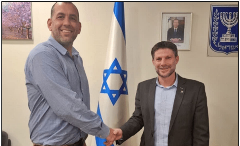
שר האוצר בצלאל סמוטריץ' והממונה על השכר אפי מלכין

ימים בודדים לפני היציאה לחופשת הפסח, הודיע ארגון המורים העל-יסודיים על החרפת העיצומים בהם הוא נוקט לאחרונה. זאת במחאה על אי חתימת הסכם השכר החדש בינו לבין משרד האוצר. כזכור, בתחילת השנה נמנעה שביתה בתיכונים לאחר שמשרד האוצר וארגון המורים הגיעו להבנות במרבית הנושאים. ארגון המורים הסכים לפתוח את שנת הלימודים תוך התחייבות מצד האוצר כי ההסכם כולו ייחתם עד חודש דצמבר 2023. אולם בחסות המלחמה, חזרו בהם אנשי משרד האוצר מהסיכומים. כעת מתנה האוצר את תוספות השכר והחתימה על ההסכם בויתורים נוספים מצד ארגון המורים.