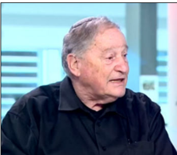
מחריף מאבק המורים / 6