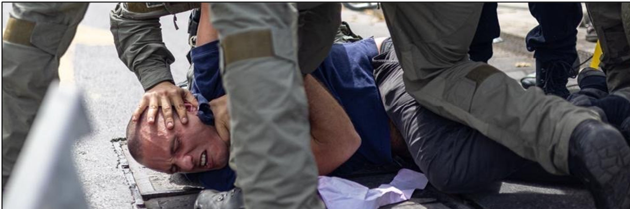
שוטרים מתנפלים על משתתף בהפגנה במרכז ירושלים נגד המלחמה בעזה, 29 במרס