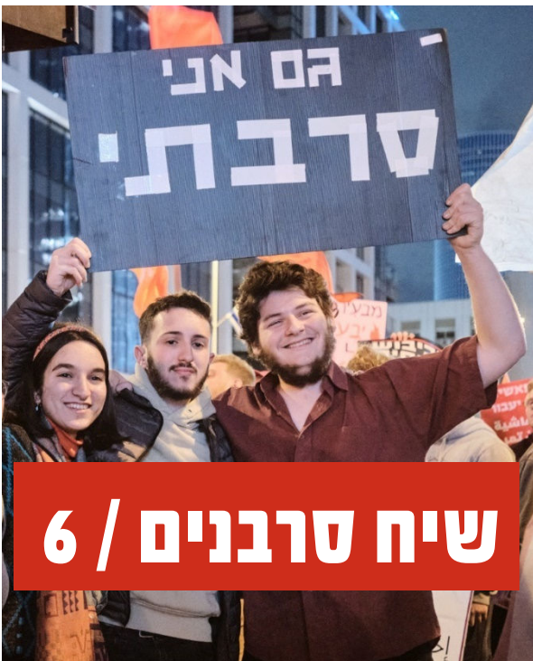
שיח סרבנים / 6