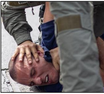
מבול הצעות חוק לכרסום החירויות עמ' 7