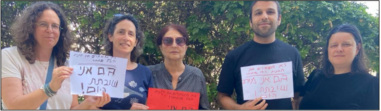
מורי תכנית היל"ה המופרטת של משרד החינוך בעת השביתה בשבוע שעבר