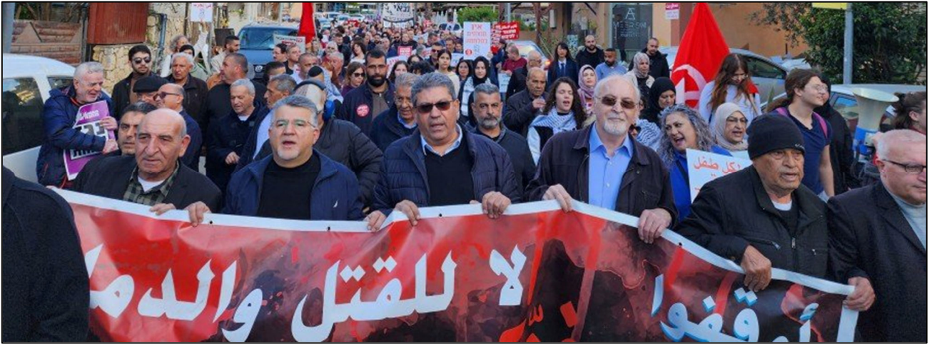
מנהיגי חז"ל וחד"ש בהפגנה בדיר חנא לציון יום האדמה, 30 במרץ 2024