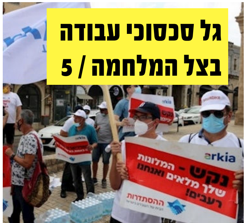
גל סכסוכי עבודה בצל המלחמה / 5