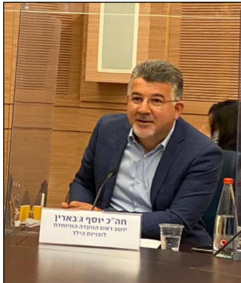
יו"ר הוועדה לזכויות הילד, ח'כ יוסף ג'בארין

במסגרת פיקוח הוועדה על ההיערכות לשנת הלימודים תשפ"א, קיימנו לאחרונה דיון בעניין המצוקה התקציבית שפקדה את תוכנית היל"ה ותוכניות נוספות לרווחת ילדים ובני נוער בסיכון. המדיניות הניאו-ליברלית של הממשלה, כמו גם המשבר הפוליטי בין הליכוד לבין כחול לבן שלקחו