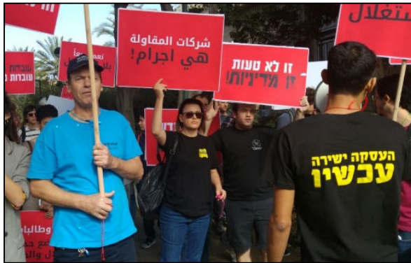
הפגנה למען העסקה ישירה באוניברסיטת ת"א

בתנאי ההעסקה של עובדות הניקיון באוניברסיטה יש מן המשותף - כולן, גם אלה העובדות בה מעל חמש עשרה שנים,