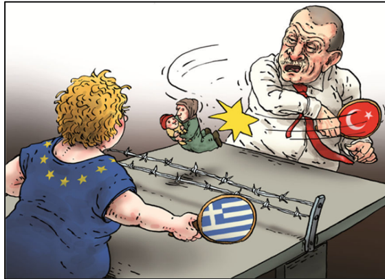
איור: יופ ברטראמט

יש אולי קורטוב של צדק בטענתה של ממשלת תורכיה כי המדינה אינה מסוגלת לקלוט עוד פליטים מסוריה, אולם היא משתמשת באסונם של הפליטים בצורה צינית לגמרי. בין הפליטים שתורכיה משגרת לאירופה ישנם ככל הנראה גם לוחמים ג'יהאדיסטים אפגניים, פקיסטאנים, אויגורים ואחרים שלחמו נגד אסד. ארדואן מגייס פליטים מאידליב גם לכוחותיו בלוב, התומכים במיליציה האסלאמיסטית של