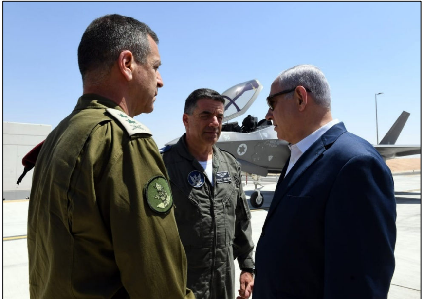
נתניהו, נורקין (במרכז) וכוכבי בשבוע שעבר

אבל השאיפות של נתניהו לא יתממשו. למרות אמירתו השחצנית אחרונה של נתניהו באירוע בהתנחלות רבבה ("לא נחזור על שגיאות העבר, בכל תוכנית מדינית לא יעקף מתיישב אחד"), הפתרון האפשרי היחיד הוא שלום צודק לסכסוך הישראלי-פלסטיני: סיום הכיבוש והקמת מדינה פלסטינית, שירושלים המזרחית בירתה, בצד ישראל בגבולות ה-4 ביוני 1967.