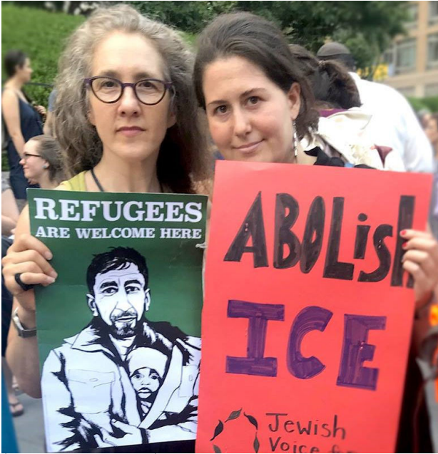
פעילות בהפגנה בניו-יורק נגד טראמפ

המפריד. מדובר בפעילים נחושים ומסורים, שאינם מפחדים להיכנס לעימות עם הממסד היהודי ואף להיעצר בהפגנות ובמחאות הרבות שהם מקיימים גם מול הקונסוליות הישראליות המפוזרות ברחבי ארה"ב.