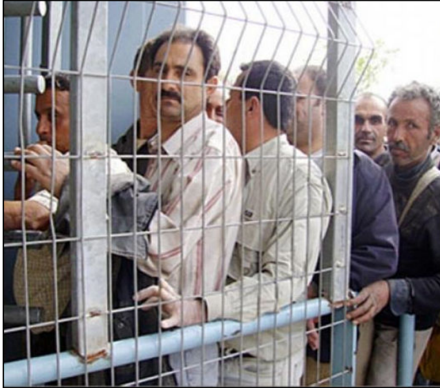
פועלים פלסטינים במחסום בדרכם לישראל