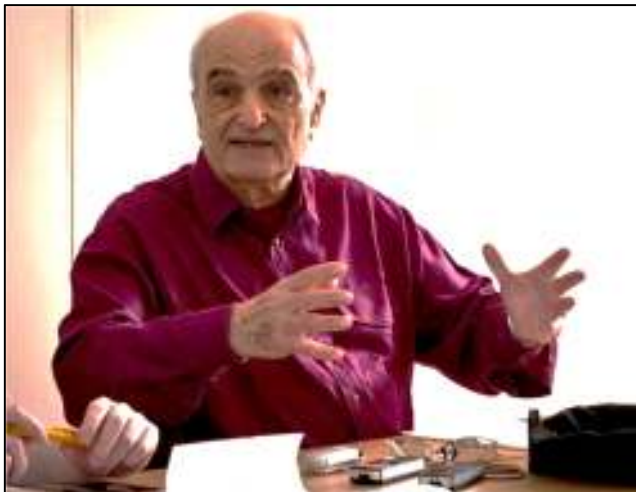
משה מחובר

את פרשת סילוקו של משה מחובר יש להבין על רקע המאבק בתוך מפלגת הלייבור בין המנגנון המפלגתי, שעדיין מורכב מתומכי טוני בלייר, לבין תומכי ג'רמי קורבין. קורבין הוא המנהיג הראשון של הלייבור מזה שנים שמבקר את הכיבוש הישראלי ותומך בעקביות בזכויות העם הפלסטיני. השיקול הציני של אנשי השגרירות הישראלית והמשרד של ארדן בהכפשת שמו של קורבין ברור: אם ייצא להגנת מחובר, יוכיח כאילו את אנטי-ישראליותו (הם כבר ידאגו להציג אותו כאנטישמי); אם ישתוק, יאבד את תמיכתם של חלק מחברי המפלגה.