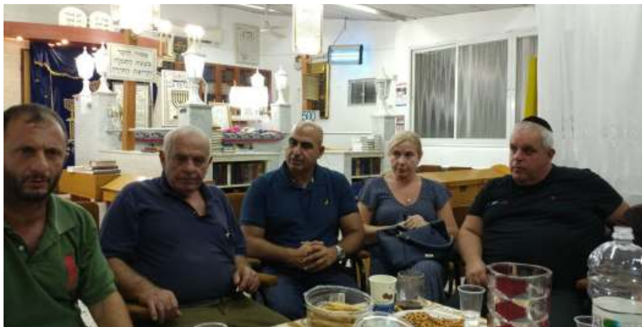
אסיפת תושבים ופעילים בבית הכנסת באבו כביר בשבוע שעבר