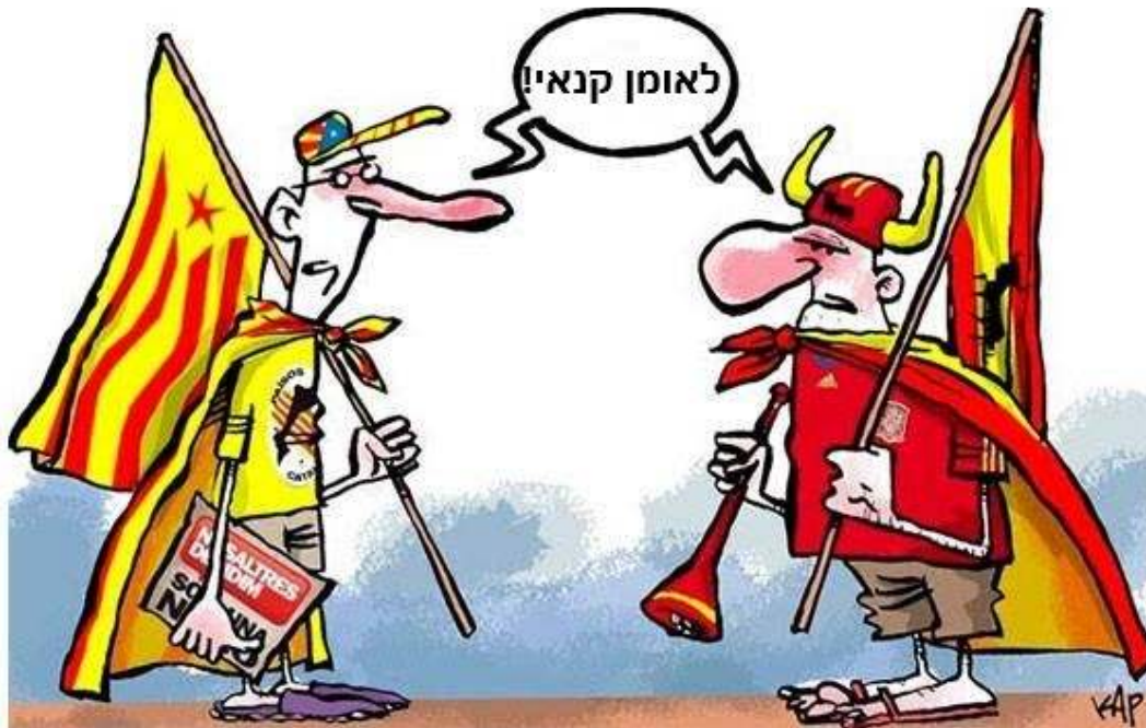
איור: קאפ, מונדו אבררו