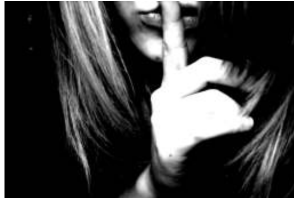
“לא צריך לעצור אותך כדי להשתיק”

למזלי הרב, למדתי לקראת התארים המתקדמים בסן פרנסיסקו. האקלים החברתי שם שונה מאוד. חלק מתכנית הלימוד של סטודנטים לפסיכולוגיה הוא לקשור בין סבל נפשי לבין דיכוי והדרה. אי אפשר להיות קלינאיות בלי להכיר בתופעות של ניצול חברתי, ולנקוט עמדה פעילה נגדן. להיות פסיכולוג משמעו לשאוף לאוונגרד חברתי, לצאת נגד גילויי שמרנות ואפליה. לא ניתן לקבל בסן פרנסיסקו רישיון לעיסוק בפסיכולוגיה קלינית מבלי ללמוד קורסים בנושאים חברתיים, כאשר הנושא המודגש ביותר הוא השפעותיה ההרסניות של גזענות על הבריאות הנפשית. בישראל המצב שונה בתכלית. עד היום מלמדים כאן פסיכולוגים לחשוב באופן מנותק לחלוטין מהקשר פוליטי. ובכל זאת, קמה קבוצה כמו פסיכואקטיב, וישנן עוד קבוצות פוליטיות של אנשי מקצוע, בעיקר של עובדים סוציאליים. אני אסירת תודה על כך שלמדתי בסן פרנסיסקו. אי אפשר לטפל בלי להיות מודעת לדיכוי, בלי לנקוט עמדה פעילה של התנגדות לעולות החברתיים העמוקים, ולהביע נכונות לטפל גם בחברה.