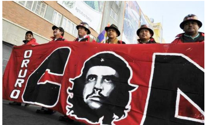
כורים בוליביאנים משתתפים בשבוע שעבר במצעד לציון 50 שנה למוות של גווארה

2011, ארגנטינה (ספרדית, כתוביות באנגלית) אחרי ההקרנה תתקיים שיחה עם תום שובל מוצ"ש, 21 באוקטובר, 20:00, אחד העם 70, תל אביב