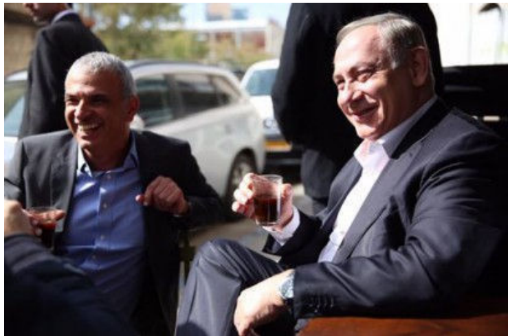
נתניהו וכחלון מרוצים

עם עודף הכנסות מצטבר של כ-38 מיליארד שקל, הממשלה דווקא קיצצה 20 מיליארד בהוצאות, ומתכננת להמשיך ולקצץ