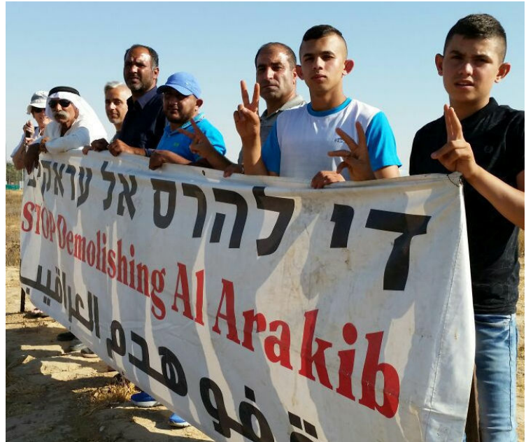
מפגינים נגד הריסת הכפר אל-עראקיב, אותה המדינה הרסה יותר מ-100 פעם

דו"ח חדש חושף את ממדי האכזריות של המדינה כלפי אזרחיה הערבים בנגב