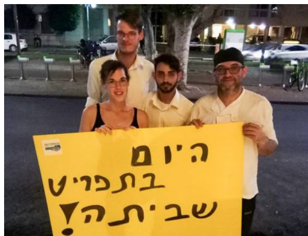
עובדי "קפה נואר" שובתים

בתום 14 ימי סכסוך עבודה, עליו דווח ב"זו הדרך" (23.8), שבתו בשבוע שעבר עובדי "קפה נואר" שעות מספר ועזבו את משמרותיהם. בימים שקדמו לשביתה, חילקו העובדים פלאיירים במטרה להסביר ללקוחות המסעדה את החלטתם לשבות.