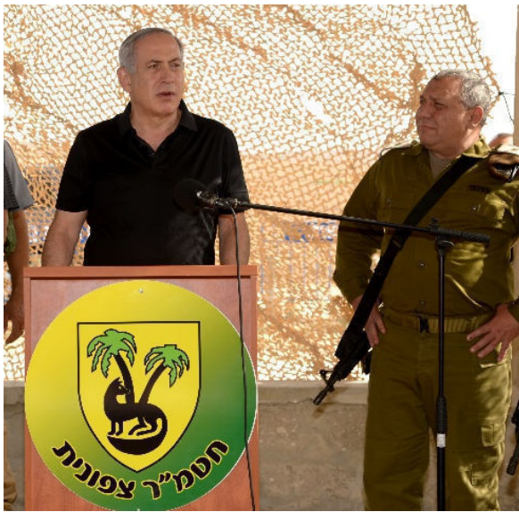
אייזנקוט ונתניהו בגבול הצפון

מספיק חזק בשביל שנים של שקט, אלא הכרעה, הצהיר קצין בכיר בפיקוד הצפון שצוטט ברוב כלי התקשורת הישראליים (4.9). הכתב הצבאי של ערוץ 20, נועם אמיר: "בצה"ל קוראים להישג הבא 'הכרעה'. לא משנה אם יתקיים עימות בצפון או בדרום, המטרה הראשונה היא להכריע את האויב ולגרום לו להרים דגל לבן" (5.9). בחדשות ערוץ 2, התוודה הפרשן אהוד יערי על אכזבתו מתוצאות מלחמת האזרחים בסוריה: "ישראל הייתה יכולה לייצר מצב שבו המורדים, לא אל-קאעידה ולא דאע"ש, יושבים ושולטים בכל מרחב הדרום עד למבואות של דמשק. ישראל לא רצתה לעשות זאת כי יש אצלנו רתיעה מלפעול מעבר לגבול" (26.8).