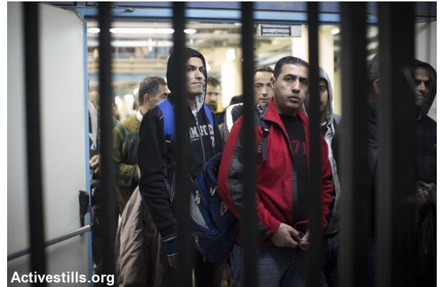
עובדים פלסטינים במחסום, טולכרם

פעילי עמותת קו לעובד ערכו בשבוע שעבר סדנה בנושא זכויות עובדים לקבוצת נשים פלסטיניות המועסקות בישראל. רובן מועסקות בענף החקלאות. מקו לעובד נמסר כי מעסיקים ישראלים בהתנחלויות ובישראל מלינים את שכרן של נשים פלסטיניות ואינם מעניקים להן באופן גורף את הזכויות הסוציאליות הקבועות בחוק: ימי חופשה, דמי הבראה, ימי מחלה, שעות נוספות, הפרשה לפנסיה ופיצויי פיטורין. רבות מהעובדות הפלסטיניות הן נשים מעל גיל 50, שבשל גילן אינן נדרשות להחזיק בהיתר כניסה לעבודה בישראל. כתוצאה מכך, הן אינן נרשמות כמועסקות ולא מקבלות תלושי שכר. דפוסי ההעסקה הלא מתועדת פוגעים במובהק ביכולתן של העובדות לדרוש זכויות אשר נגזלו מהן מהמעסיק. גם במקרה של תאונות עבודה, על העובדות מוטלת חובת ההוכחה שהעסקתן אכן התקיימה, על מנת שיוכלו לקבל טיפול רפואי מסובסד, פיצויים או קצבת נכות.