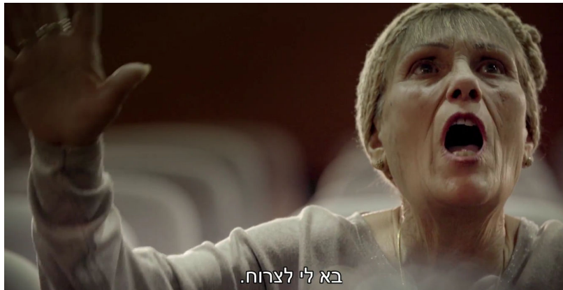
בא לי לצרוח.

מסיפוריהם של מרואיינים בסרט, תושבי ירוחם, עולות שוב ושוב הבטחות אנשי הסוכנות היהודית: "תהיה לכם ולילדיכם פרנסה", אך עיירות הפיתוח פיתחו בעיקר עוני. תושביהן המזרחים נשרו עד מהרה לתחתית הסולם