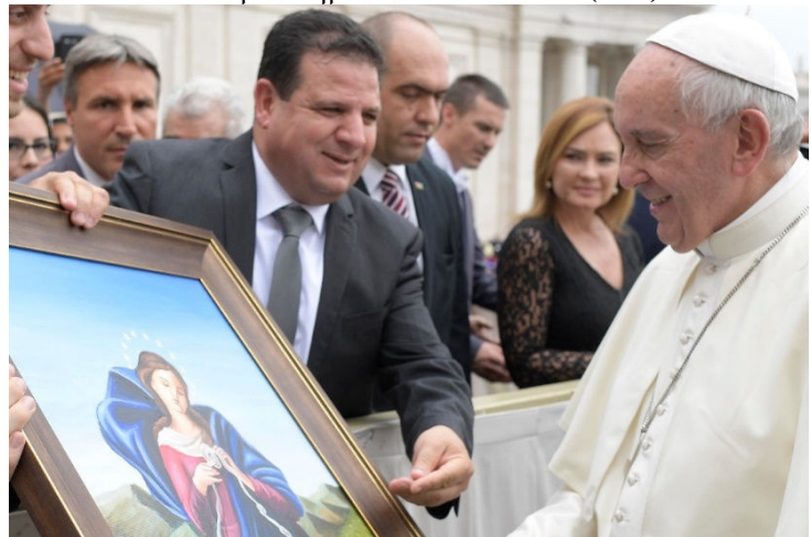
האפיפיור פרנציסקוס ויו"ר הרשימה המשותפת ח"כ איימן עודה