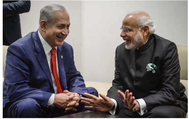
מודי ונתניהו בעת הוועידה בפאריס ב-2015

הודו היא אחד השווקים המתפתחים והצמיחה בה בשנים האחרונות עולה אף על הצמיחה הסינית (יותר מ-7% בשנה). מבחינת ישראל הודו היא שוק עצום, כבר היום, הודו היא יעד הייצוא ה-9 בגודלו מישראל. ויעד הייצוא מספר 1 לתעשיית הנשק הישראלית, שמעבירה להודים טכנולוגיות משוכללות שאף מדינה אחרת לא מוכנה למכור להם. שתי המדינות נמצאות כיום במו"מ על כינון הסכם סחר משותף. בחמש השנים האחרונות הייתה הודו 'בואנית הנשק הגדולה בעולם (13%) ולפי 'מכון סטוקהולם לחקר השלום' (SIPRI) היא מייבאת מרוסיה (68%), ארה"ב (14%) ומישראל (7.2%). לאחרונה גוברת התחרות של ארה"ב מול ישראל בייצוא נשק להודו. ישראל מייצאת להודו גם בתחומים אחרים: חקלאות ומים, לווייני תקשורת, בריאות ומחקר מדעי. הביקור של מודי צפוי לחזק את המחנה הריאקציוני בעולם ולא ישרת את האינטרס של עמי הודו וישראל בדמוקרטיה, שלום, שגשוג ושמירת זכויות האדם ובהנהגה דמוקרטית יותר ונאורה יותר.