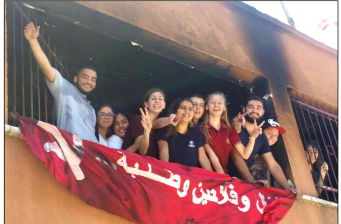
פעילי בנק"י בעראבה

ושלכן משדרות רק כוח. במקום האווירה העצובה שלה ציפיתי בבואי לבקר, מצאתי צעירים איתנים מעוררים שמחה וכוח. ההון העיקרי שיש לנו במפלגה הוא ההון האנושי. כל השאר בר שיפוץ ופיצוי, וממה שאני רואה מולי כאן, אתם יוצאים מזה חזקים יותר, אמיצים יותר, ונחושים לשיפור כל הנזק שנגרם. התשובה למציתים חייבת להיות בשיפוץ המטה במהירות האפשרית והחזרתו לפעילות כבית חם לבני הנוער לערכי המפלגה והחזית".