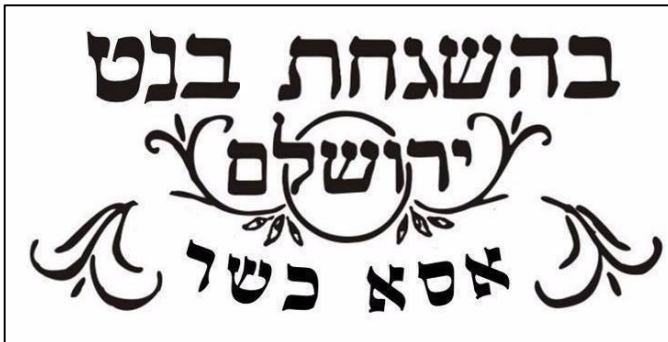
כרה שפרסמו סטודנטים מאוניברסיטת תל אביב

עוד נמסר מוועד ראשי האוניברסיטאות כי "עיון מדוקדק בהצעת הקוד מראה כי אף שהוא מוגדר כ'קוד אתי של ההתנהלות הראויה בתחומי חפיפה בין פעילות אקדמית