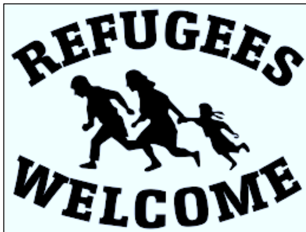
"פליטים ברוכים הבאים"