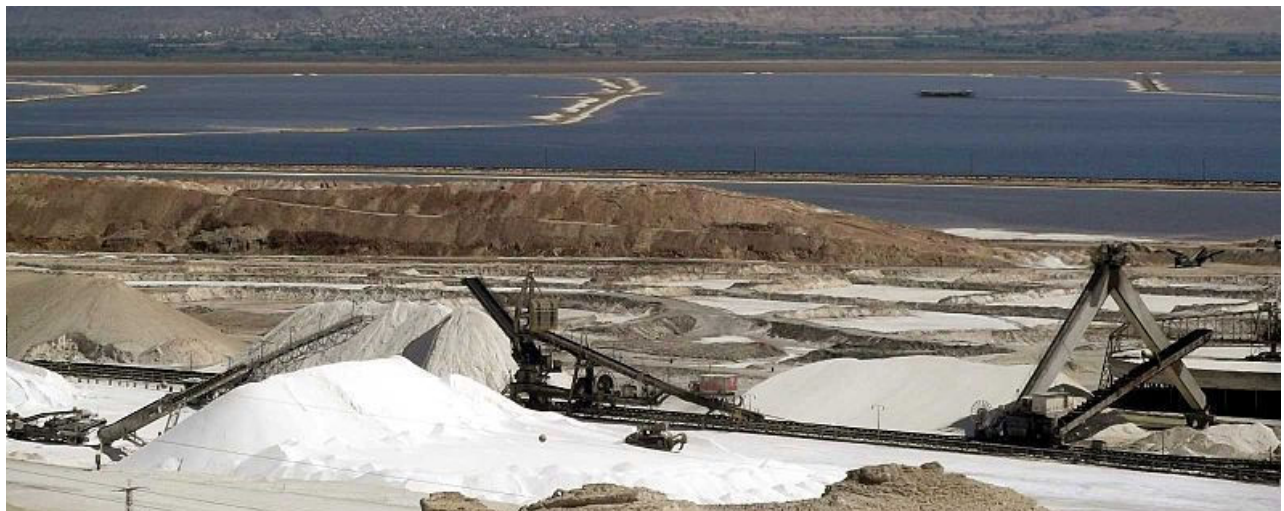
מפעלי ים המלח