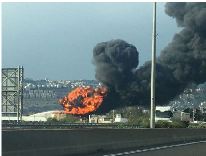
אש בוערת במפרץ חיפה, צילום: משטרת ישראל

זה מפגש ראשון בסדרה שמכין צוות לימוד משותף של המעגל התל-אביבי, והוא יתקיים ביום ה', 29 בדצמבר, בשעה 19:00 במשרדי קרן רוזה לוקסמבורג (שדרות רוטשילד 11, קומה 2) בתל-אביב.