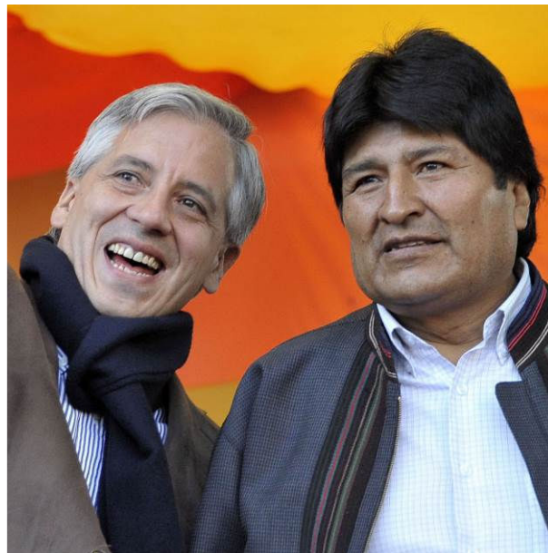
הנשיא מוראלס וסגנו גרסיה לינרה

הנסיגות בברזיל ובארגנטינה גם פגעו בבוליביה? אכן כך. אבל יש להבדיל בין המדינות. אצלנו הפרויקט החברתי של מוראלס זוכה בתמיכה עממית גדולה. בשתי המדינות השכנות התחוללו תהליכים אחרים, של רסטורציה ניאו-ליברלית.