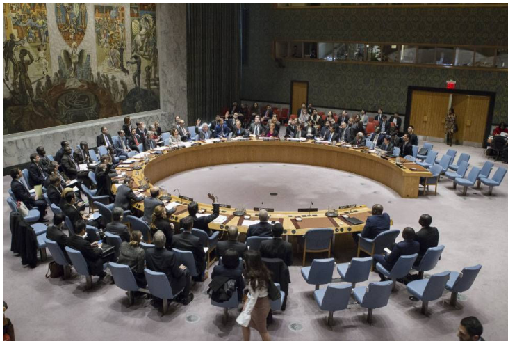
מועצת הביטחון בדיון

החלטת מועצת הביטחון של האו"ם נגד מפעל ההתנחלות, למרות מגבלותיה, היא צעד חשוב במאבק בהגמוניה הימנית-מתנחלית בישראל