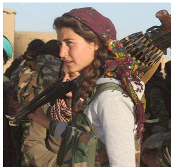
לוחמת כורדית בסוריה

קשה להבין מה קורה בסוריה – כמו בקליידוסקופ, אותן חתיכות נמצאות אך המכלול משתנה כל הזמן, צריך לעקוב, להבין את הפסיפס העדתי ולהבחין בפרטים. בסוריה נלחמים כיום, באופן ישיר ובלתי ישיר: הסעודים באירן; ישראל בפלסטינים, בחיזבאללה ובאירן; המפרציות בתנועות השיעיות; טורקיה בכורדים; ארה"ב ונאט"ו באל-קעידה ודאעש; ונאט"ו נגד רוסיה בגלל אוקראינה. ארגונים איסלמיסטיים נלחמים בתנועות חילוניות, שמאל בריאקציה וקבוצות עדתיות שונות על כוח יחסי. כמעט מראשיתה הפכה המרידה באסד למלחמה שמעורבות בה מדינות רבות ותנועות הנלחמות למען אינטרסים זרים.