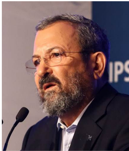
אהוד ברק בכנס הרצליה לאחרונה

שמעו על ה"נדיבות" של ברק. הוא ויועציו שיקרו וטענו ש"הבעיה היחידה" בשיחות קמפ דייוויד (יולי 2000) הייתה ההתעקשות הפלסטינית על זכות השיבה ועל המקומות הקדושים בירושלים. הם טרחו לטשטש את העובדה שהכשל העיקרי במשא ומתן, לפני פרוץ האינתיפאדה השנייה, היה הסירוב הישראלי לפנות התנחלויות, ואפילו עמדו על סיפוח שטחים בגדה (בלי להעניק אזרחות לתושביהם הפלסטינים). אין הבדל בין "התהליך המדיני" שברק מאוהב בו והפצת "שקרים על שלום" (כפי שכנתה אותם בספרה פרופ' טניה ריינהרט ז"ל), לבין השמועות המופצות חדשות לבקרים מצד נתניהו בדבר ממשלת אחדות שתפעל ל"האצת תהליך מדיני", לצד ההבטחות ל"שמירה על ירושלים