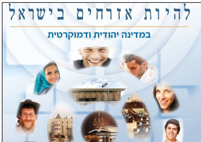
ספר האזרחות השנוי במחלוקת

לרגל תחילת שנת הלימודים, שוחחנו עם מורה צעיר להיסטוריה על אודות המשמעות הפוליטית של המקצוע, ואיך זה להיות איש שמאל בימי שר החינוך בנט