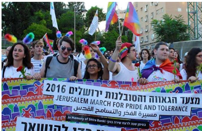
צועדים במצעד הגאווה בירושלים

כ-25 אלף בני אדם השתתפו (21.7) במצעד הגאווה בירושלים, שהיה המצעד הגדול ביותר אי פעם. המצעד התקיים לציון שנה לרצח שירה בנקי ועל רקע התבטאויות רבנים נגדו ונגד קהילת הלהט"ב. בין המשתתפים הרבים: פעילי חד"ש, מק"י, בנק"י ותנועת "עומדים ביחד".