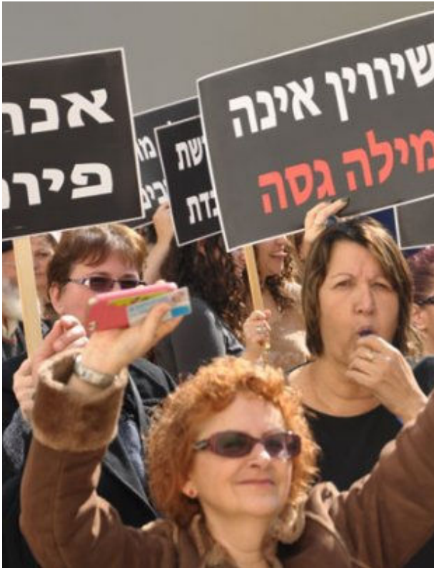
הפגנת עובדים בקמפוס אוניברסיטת בן גוריון בבאר-שבע

100 מרצים נפגשו בתל-אביב על מנת לקדם דגם אחר להשכלה הגבוהה